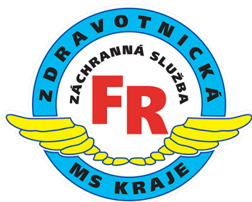
LOGO FIRST RESPONDER

Učinila další krok podporující úspěšnou záchranu pacientů. Pokud voláte na linku 155 , může k vám ještě před příjezdem profesionální posádky přijít zachránce v civilním oděvu, tzv. FIRST RESPONDER . Jde o zdravotníka, policistu, hasiče, či člena jiné organizace, vyškoleného v poskytování první pomoci. Nechte FIRST RESPONDERA pracovat. Může VÝZNAMNĚ přispět k ZÁCHRANĚ ŽIVOTA PACIENTA .