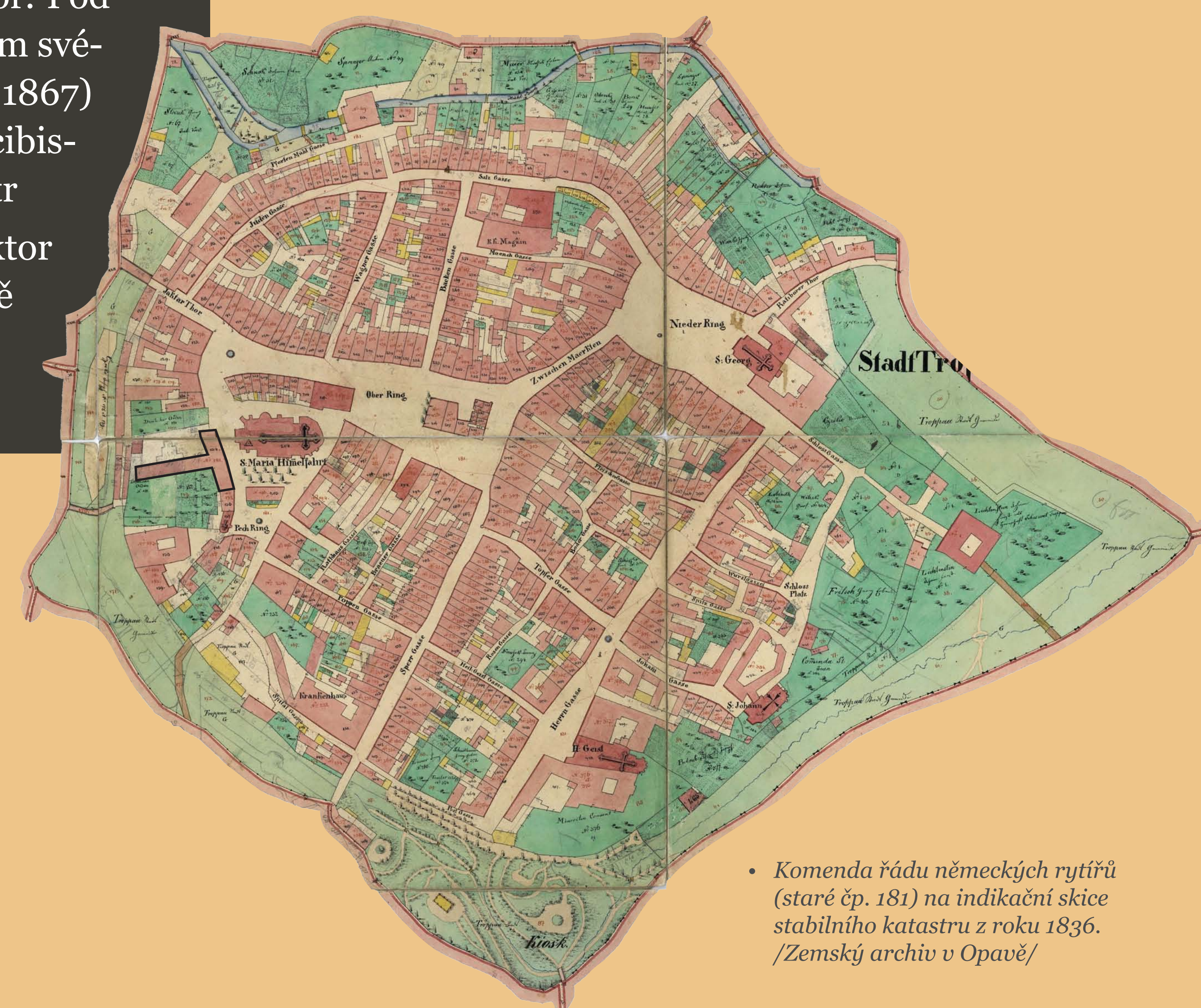
• Komenda řádu německých rytířů (staré čp. 181) na indikační skice stabilního katastru z roku 1836. /Zemský archiv v Opavě/