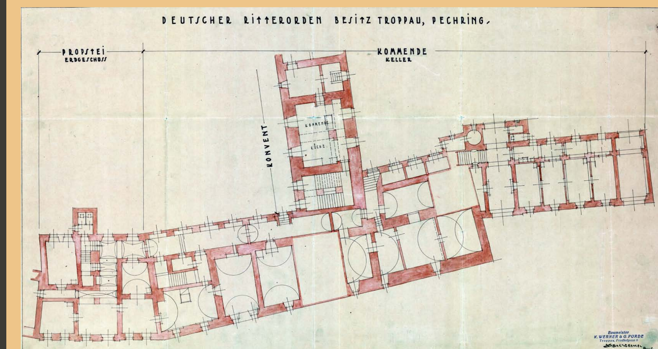
• Plánová dokumentace zvýšeného suterénu a parteru komendy řádu německých rytířů, vlevo dokumentována samostatná budova proboštství, vpravo pak křídlo komendy dostavěné na začátku 60. let 19. století; plány vypracovány ve 30. letech 20. století opavskou stavební firmou Karl Werner a Gustav Purde. /Stavební archiv Magistrátu města Opavy/