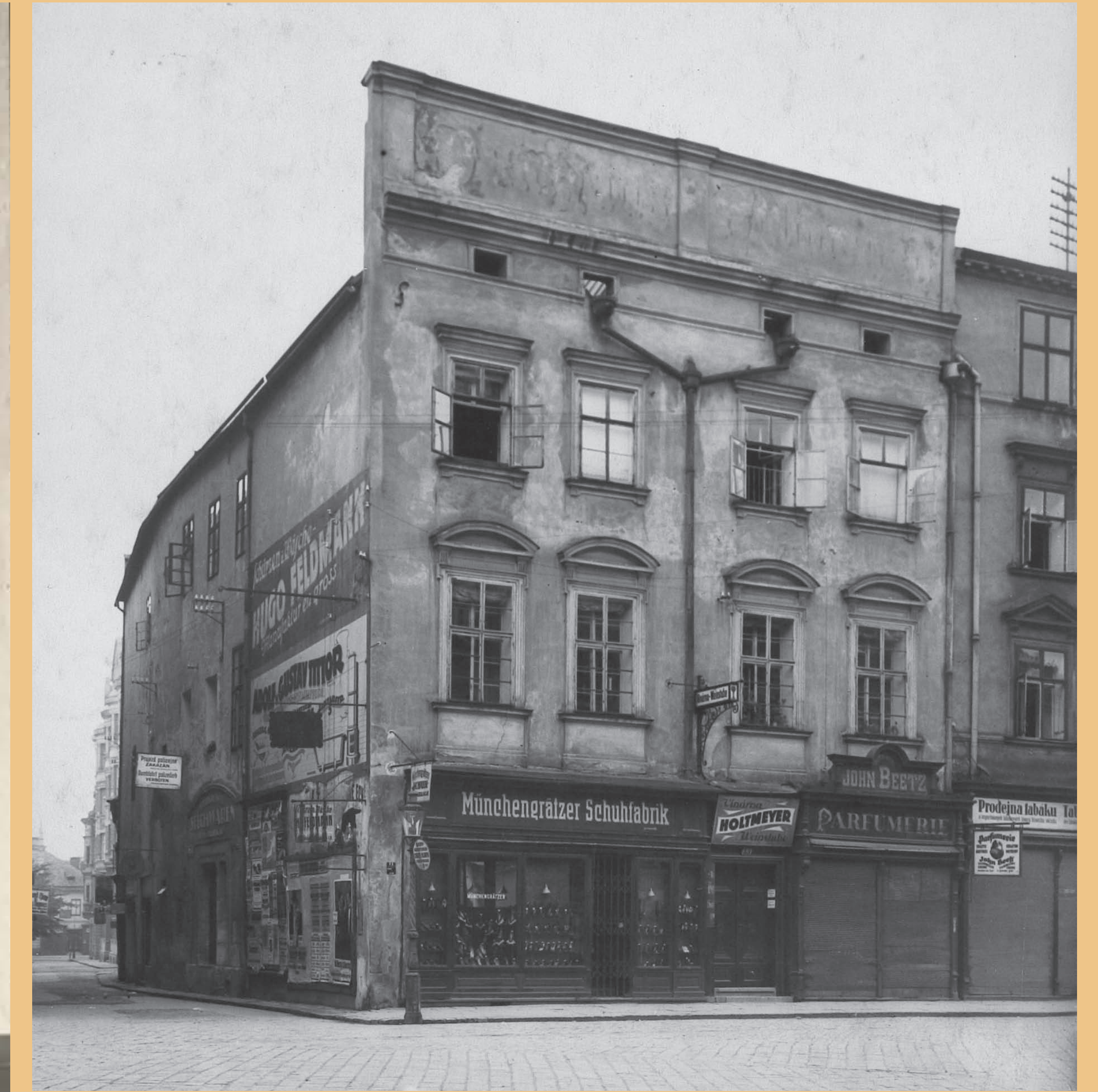
• Původní podoba průčelí domu na fotografii z 30. let 20. století. V 60. letech 20. století byl dům rekonstruován podle návrhu architektů Adamce z olomouckého Stavoprojektu. Parter byl vytvořen novodobým podlažím a interiéry rekonstruovány včetně dispozicích změna a restaurování malovaného stropu. Především však došlo k zásadní úpravě průčelí s částečně dochovanými gotickými zřívem, které bylo strženo a nahrazeno novotvarem imitujícím (nedoloženou) renesanční podobu. /Slezské zemské muzeum/