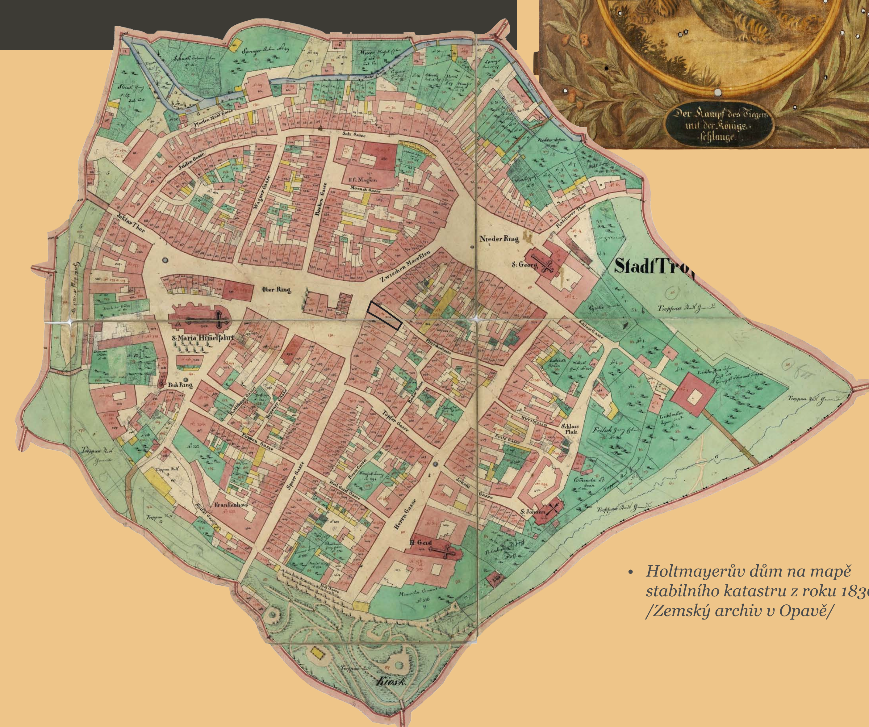
• Holtmayerův dům na mapě státního katastru z roku 1836.