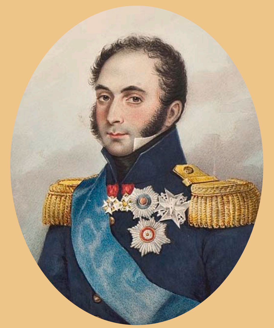
• Podobizna francouzského diplomata Augusta de la Ferronnays z tzv. Middletonskeho alba akvarelových portrétů, uchovávaných v Hillwood Museum ve Washingtonu (USA).