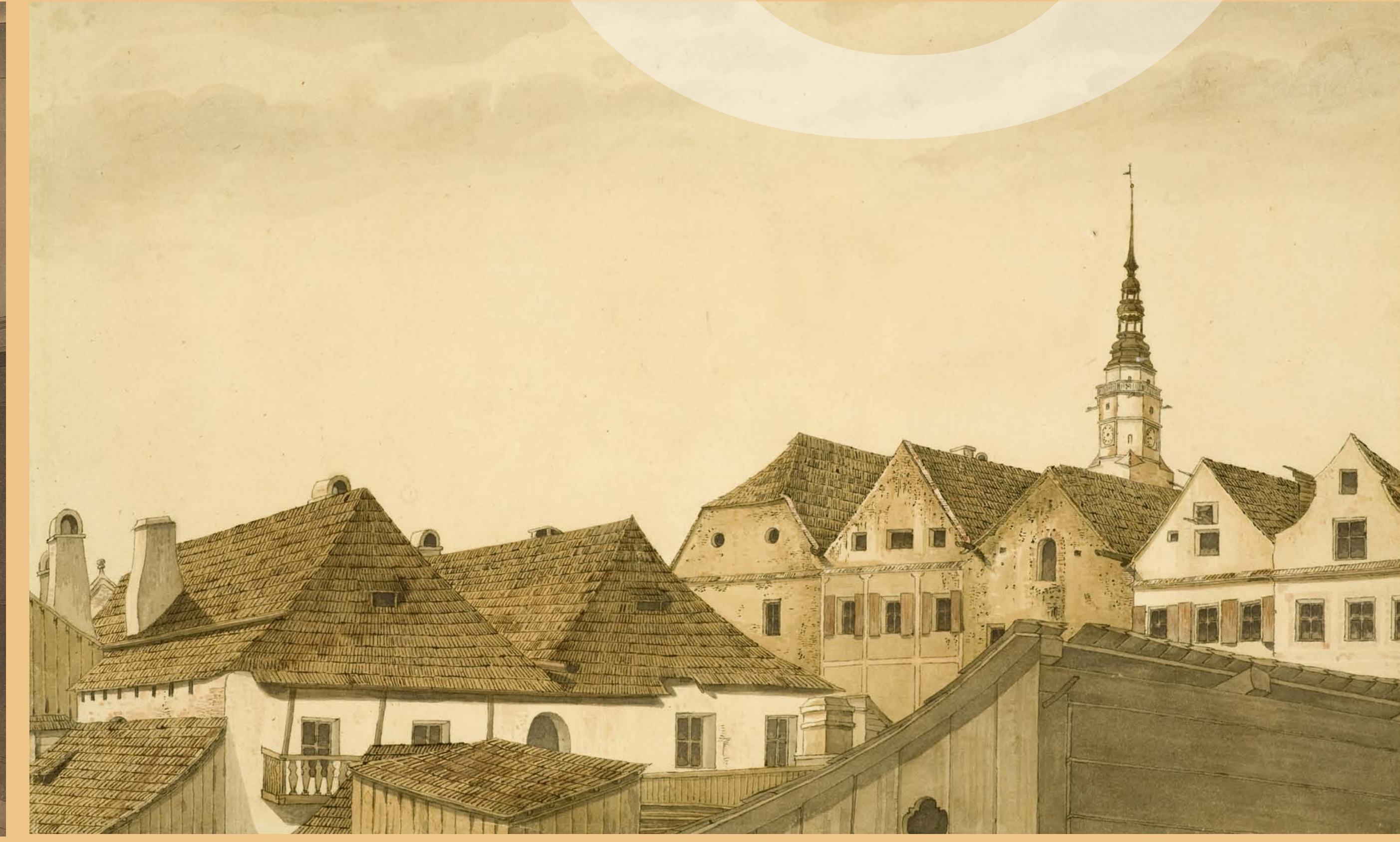
• Zřejmě takovýto výhled měl francouzský diplomat z bytu Franze Biely do dvora jeho domu. Vlevo zadní trakty domů na Pekařské ulici (dnes čp. 146 a 151), uprostřed a upravo zástavba Horního náměstí (dnes čp. 143 a 145), v pozadí věž Hlášky.

Francii zastupoval na kongresu její vyslanec v Sankt-Petěrburgu Pierre Louis Auguste Ferron, hrabě de la Ferronnays (1777–1842). Druhým zástupcem francouzské diplomacie byl vyslanec ve Vídni Louis Charles Victor de Riquet de Caraman (1762–1839), který se ubytoval za 800 zlatých v domě obchodníka Leopolda Klosoho s tehdejšíím číslem popisným 144 (dnes dům 132/47 na Horním náměstí, severně od Hlášky). Oba diplomaté však nebyli oprávněni svou vládou cokoli závazně podepsat, proto na jedná-ních působili v rolích pouhých pozorovatelů.