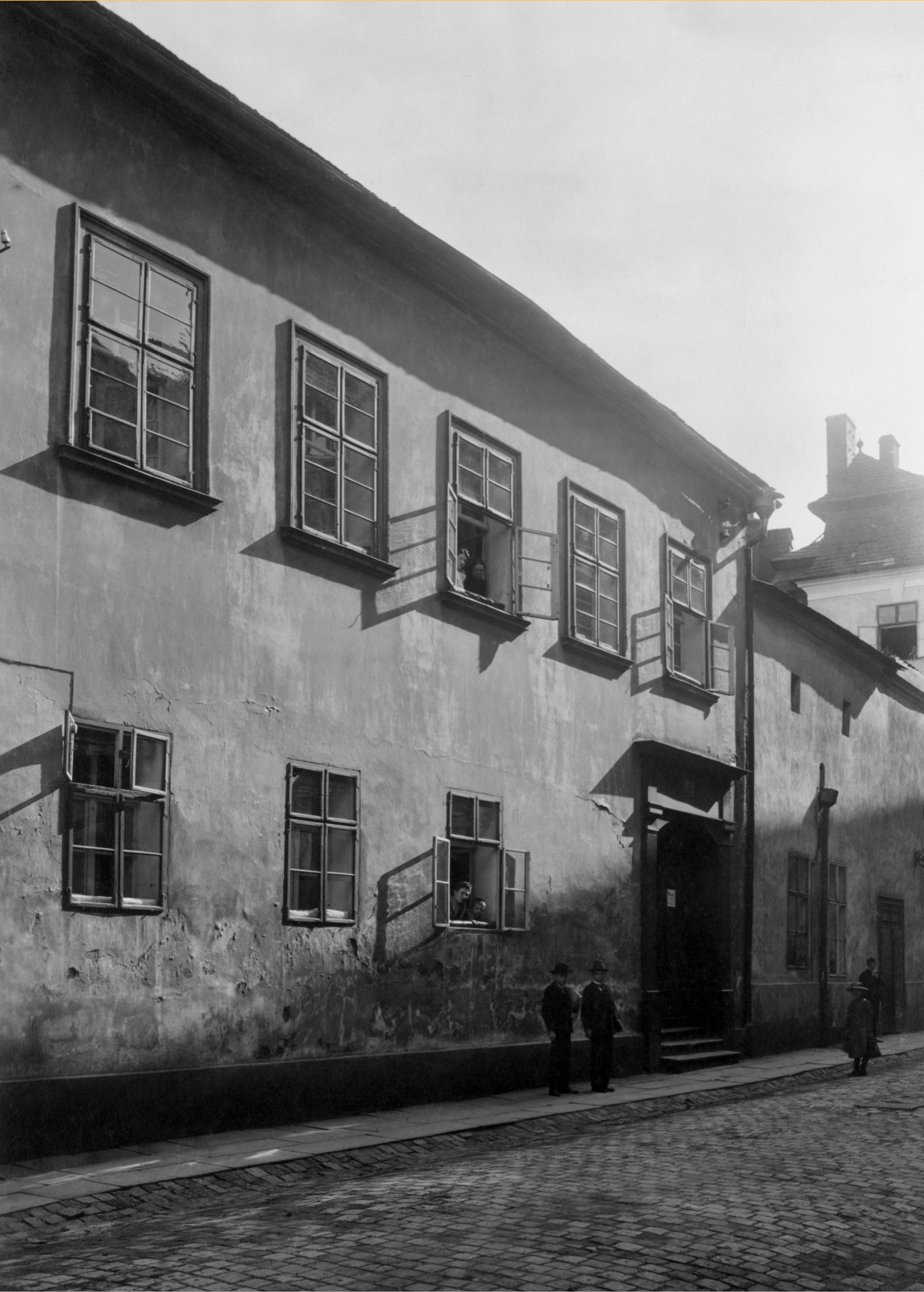
• Dům Franze Biely na Kolářské ulici kolem roku 1900. Dům byl ve druhé polovině 19. století přestavěn, ale za 2. světové války byl silně poškozen, takže musel být zbořen. Na jeho místě byl v 50. letech 20. století vystavěn zcela nový (současný) objekt.

staré číslo popisné 91, dům zbořen; na jeho místě dům na Kolářské ulici 158/4; místo ubytování francouzského velvyslance v Sankt-Petěrburgu Augusta de la Ferronnays