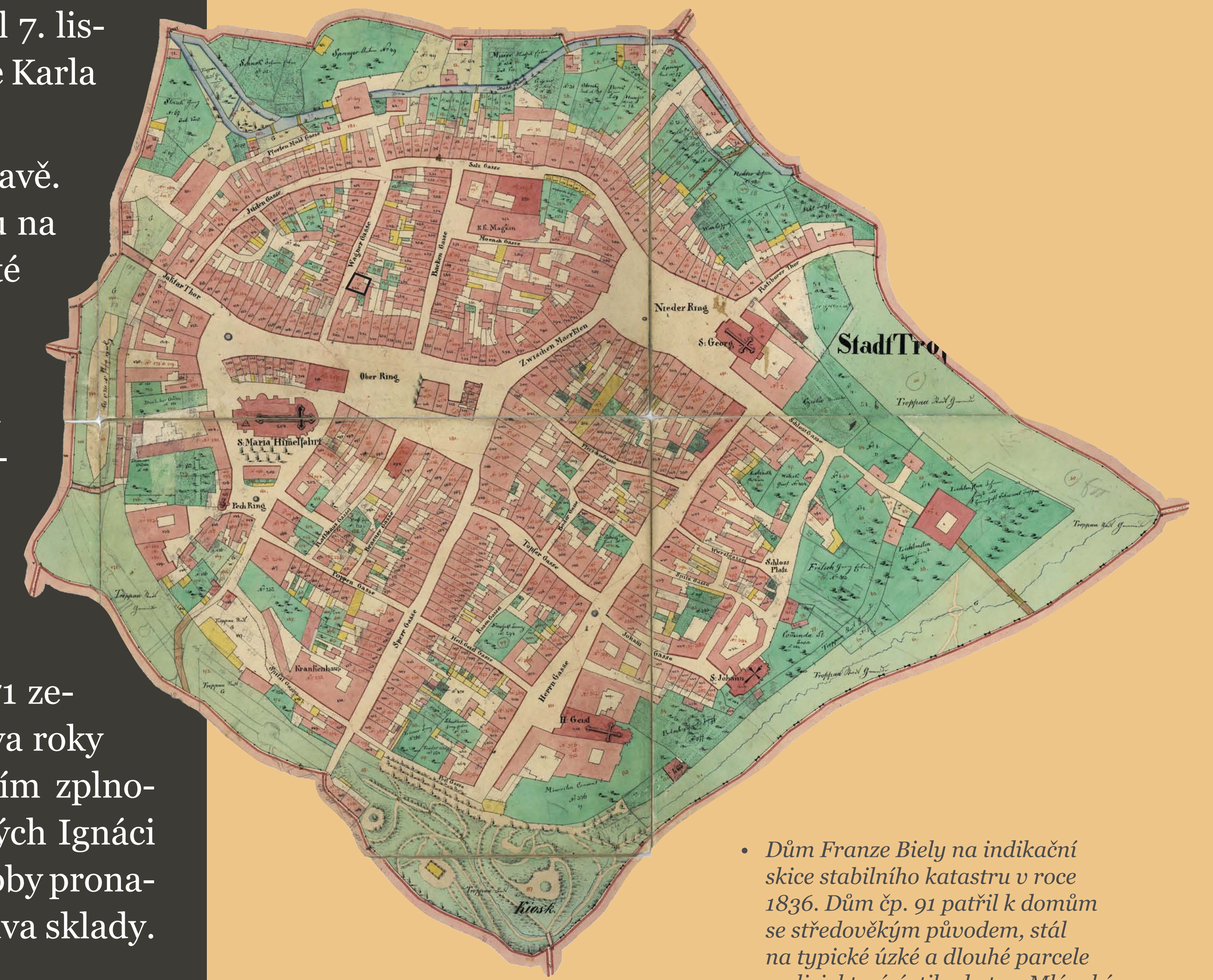
• Dům Franze Biely na indikační skice stabilního katastru v roce 1856. Dům čp. 91 patřil k domům se středověkým původem, stál na typické úzké a dlouhé parcele v ulici, která ústila do tzv. Mlýnské fortny.