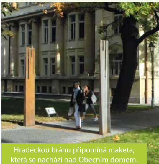
Hradeckou bránu připomíná maketa, která se nachází nad Obecním domem.