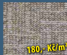
SMYČKOVÝ KOBEREC VALENCIA