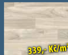
VYSOKOZÁTĚŽOVÉ PVC PRIMA