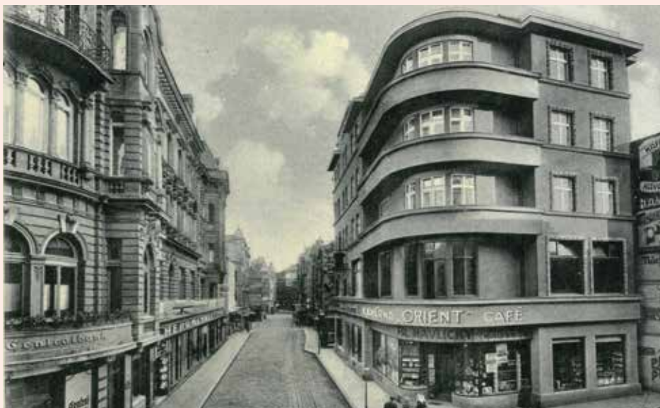
Café Orient na rohu Hrnčířské a Ostrožné ulice. Budova zde stojí dodnes, jen její funkce se změnila. Pohlednice ze sbírky Jaromíry Knapíkové

Výstava nabídne množství exponátů zapůjčených z několika muzeí v Moravskoslezském a Zlínském kraji. Dozvíte se nejen o historii opavských kaváren, ale budete moci načerpat znalosti o přípravě kávy v minulosti i dnes, o pěstování kávovníků a o zpracovávání kávových zrn. „Pozornosti jistě neunikne řada pozoruhodných obrazových materiálů,