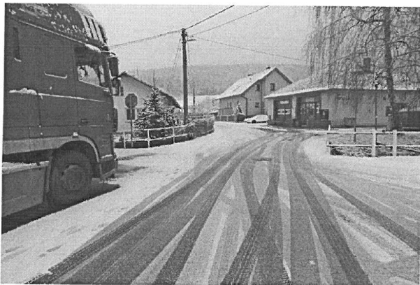
Pohled na most z komunikace III/10125 (ul. Hlavní) ze dne 10. 1. 2019

Přílohy: fotodokumentace místní úpravy provozu na pozemních komunikacích v obci Nové Sedlice – most na místní komunikaci U Hřiště