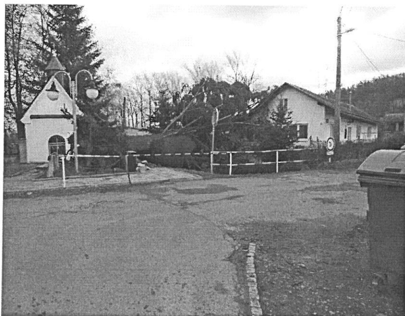
Pohled na most z komunikace III/10125 (ul. Hlavní) ze dne 11. 3. 2019, dopravní značka otočená o 90°, tím byla platnost dopravní značky zrušena.