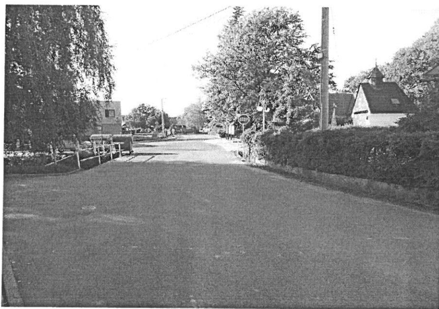
Pohled na most z komunikace U Hřiště ze dne 4. 9. 2019