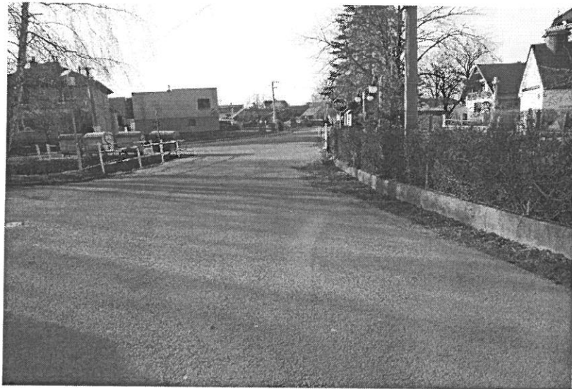
Pohled na most z komunikace U Hříště ze dne 17. 3. 2019