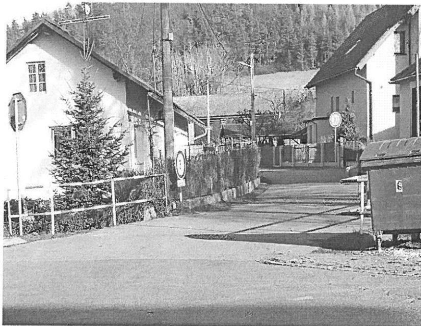
Pohled na most z komunikace III/10125 (ul. Hlavní) ze dne 17. 3. 2019, dopravní značka otočená o 90°, tím byla platnost dopravní značky zrušena při opravě mostu byla posunutá o cca 25 m na komunikaci U Hřiště.