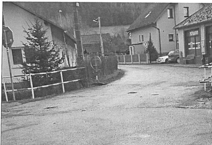
Pohled na most z komunikace III/10125 (ul. Hlavní) ze dne 14. 1. 2019