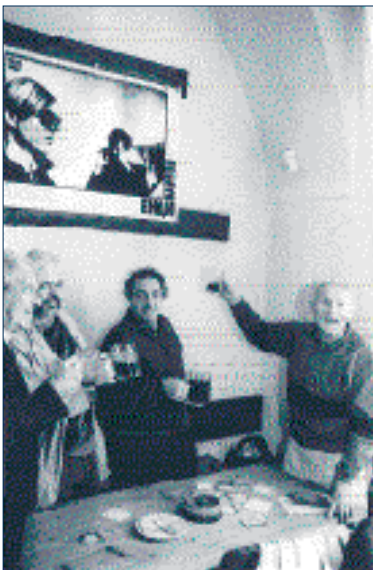
restaurace U Hynk - p ípítek Andy Warholovi

Motto: " ikám to už dlouho. Ne my, co poád hledáme a experimentujeme, ale auto i, jako jsou Jaroslav Seifert, nebo Bohumil Hrabal - ti drží pohromad sv t." Ji í Kolá