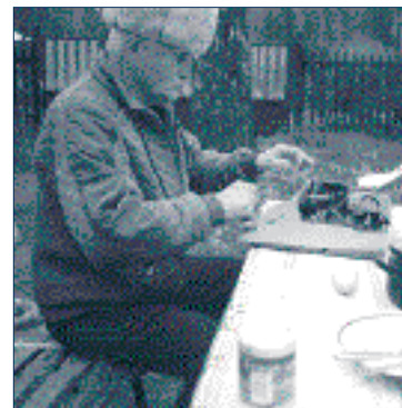
Hrabal píšící, tvořící