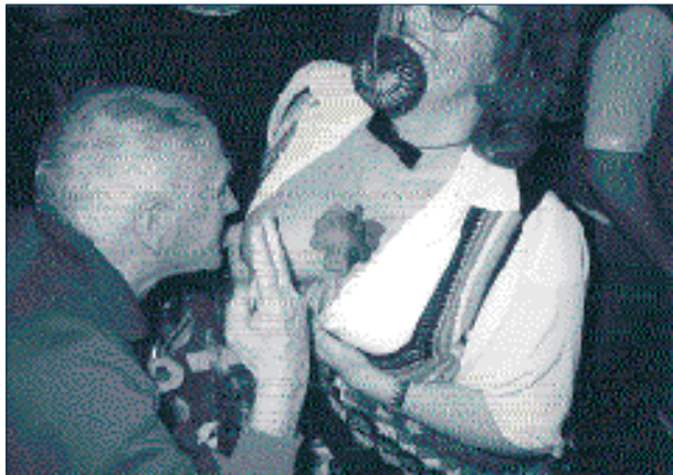
básník se svou múzou - váno ní karneval U Zlatého tygra

Po hrázi a po opuče Jak božský Mílek Se procházel s rolní kou v ruce Kulový filek