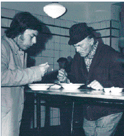
Bohumil Hrabal v automatu Sv t - Lib 1976

Smrt je dopis psaný bílou k idou na bílou desku, smrt je zaseknutý psací stroj, automat, který vyrábí zmatené zmetky, hrozící neviditelná ruka bez prstí, smrt je pád rychlíku do propasti bez dna, vysypané figurky z letadla, které explodovalo. Do poslední chvíle však je nad je na život. Obavy z toho, že není se užeho bát. Ješt tento ve er budeš stolovat s Abrahámem. Avšak ví B h, že bych radši nežral.