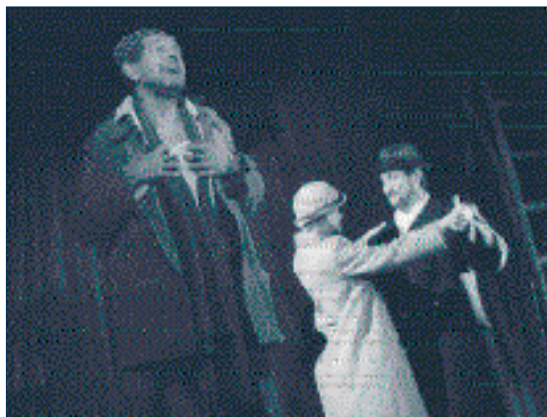
Taneční hodiny pro starší a pokročilejší