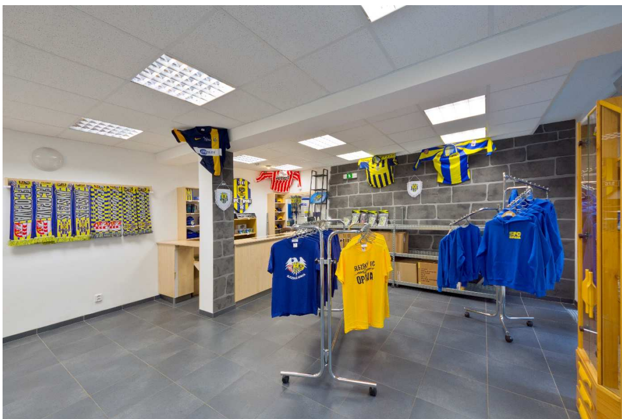
Fotografie fanshopu SFC Opava po jeho doplnění k 30.6.2016

Slezský fotbalový club Opava a.s., Lipová 2, 746 01 Opava