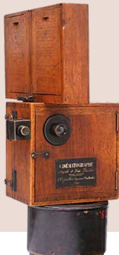
Kinematograf z roku 1898.