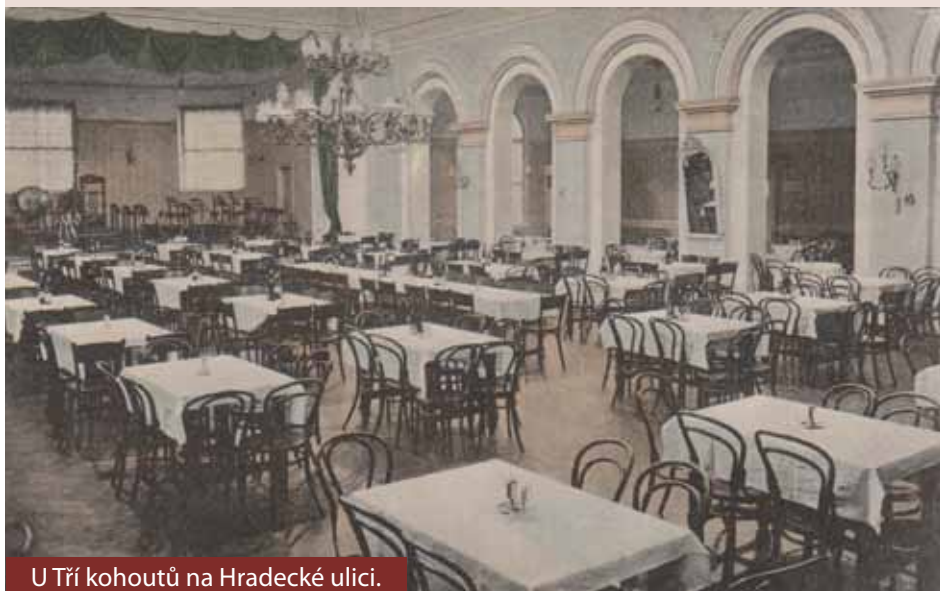
U Tří kohoutů na Hradecké ulici.