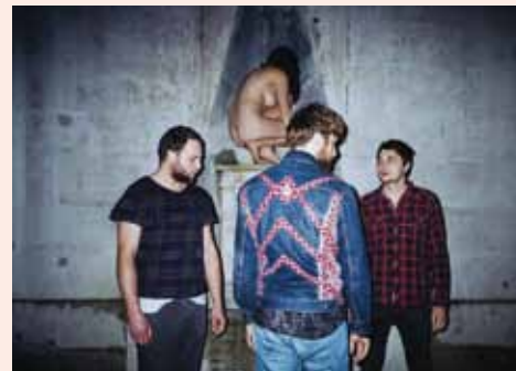
Na festivalu vystoupí také Please The Trees.

cz, kde se také dozvíte více informací o celé akci, nebo v Městském informačním centru, na recepci Obecního domu či v Café Evžen na Lepařově ulici.