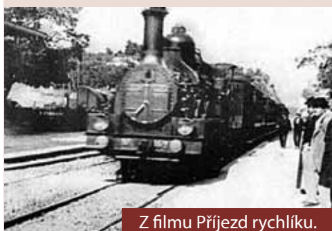
Z filmu Příjezd rychlíku.

Ještě dříve než se v Opavě ujalo stálé kino, ve společenských sálech místních pohostinství promítaly zájezdní společnosti například od Berlína k Jihlavě známé „Oeserovo elektrické divadlo“ Edmunda a Fridolína Oeserových v říjnu 1897 U Tří kohoutů na Hradecké ulici. Za třicet krejcarů (vojsko a děti za polovic) nabízely hodinové představení takzvaných živých fotografií s dobovými aktualitami i přírodopisné, cestopisné snímky graduující ke groteskám. Podkreslovaly je