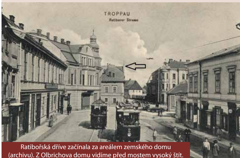
Ratibořská dříve začínala za areálem zemského domu (archivu). Z Olbrichova domu vidíme před mostem vysoký štít.