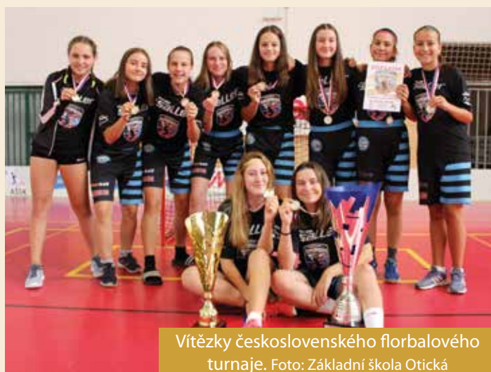
Vítězky československého florbalového turnaje.