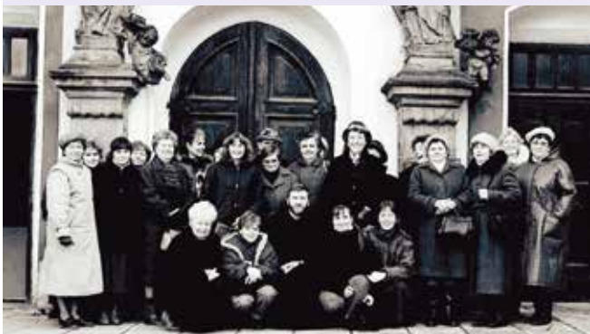
Nejstarší dochovaná fotografie týmu Charity Opava z roku 1993.

stáli u zrodu této organizace nebo se k ní postupně během třech desetiletí služby opavské veřejnosti připojovali.