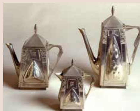
Část kávového servisu J. M. Olbricha z roku 1903