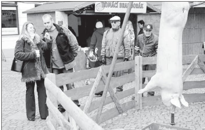
Ukázka domácí zabijačky.