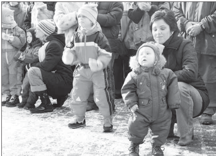
Zábava pod koncertním pódiem.