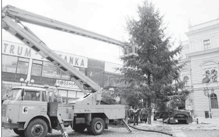
Letos se Opavané dočkali dvou městských vánočních stromů. Na snímku pracovníci Technických služeb Opava upevňují strom na Horním náměstí.