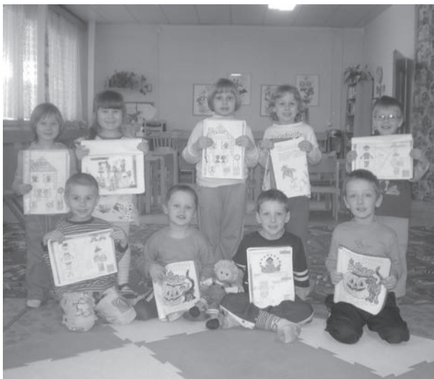
ANGLIČTINA ve školkách pokračuje.