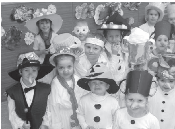
SNĚHULÁKOVÝ DEN se ve školce opravdu vydařil.

přicházely do MŠ v bílém oblečení. To bylo doplněno nosíky, metličkami, klobouky a papírovými hrci na hlavě. Dokonce nás navštívil sněhový král a královna. Maminky se opět vyznamenaly v originalitě a nápadech. Děti si o sněhulácích nejen zpívaly, ale také přednesly básně, zatančily si a hlavně parádně zadováděly v závodivých hrách. Vždyť právě velké a malé míče se