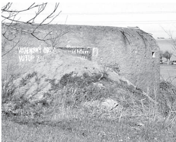
MAJETKEM se staly také bunkry v Komárově.