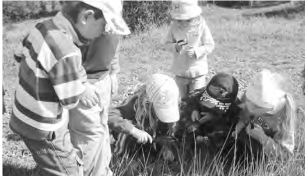
PŘÍRODU MAJÍ v mateřské škole na dosah ruky.

Nejprve bylo nutné zdolat kopec k lesu, ale odměnou byl báječný výhled na celou obec i blízké okolí. Po krátkém odpočinku jsme prozkoumali místo, na které jsme v zimě nosili zvířátkům jablka, kaštiny nebo starý chleba. Pak jsme vyrazili stezkou v lese, překonávali lesní překážky – klacíky, kaluže, důlky a propadliny a poslouchali jsme les – jeho šum, ticho i zpěv ptáků. Nejvíce se nám líbilý větrem se kymácející