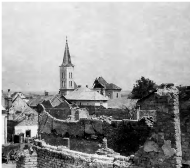
VÁLEČNÁ LÉTA Komárovu mnoho dobrého nepřinesla.

Na křižovatce silnic do Komárovských Chaloupek a Raduně byly na svažitém terénu vystavěny nebo pocházely možná i ze starší zástavby domky p. Dudy čp. 46 a p. Řičného čp. 47. Vedle nich severním směrem na místě opuštěné písčiny či hliniště, byla v r. 1929 postavena budova Orlovny s hřištěm a v r. 1931 v jejím sousedství prostornější budova pro potřebu Obecního úřadu, četnické