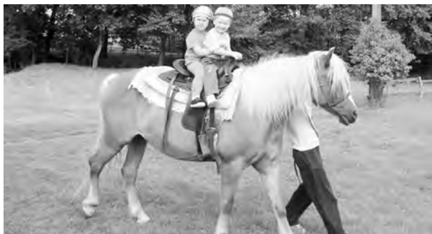
SVĚT Z VÝŠKY koňského hřbetu byl pro děti zážitkem.