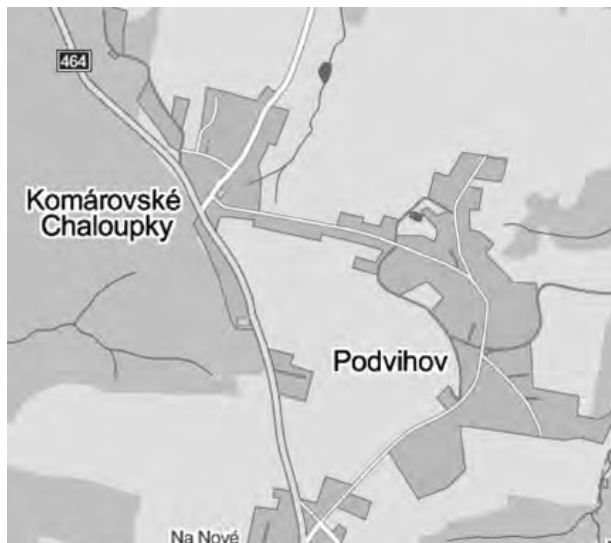
SOUČÁSTÍ KOMÁROVA byly i nedaleké Komárovské Chaloupky.