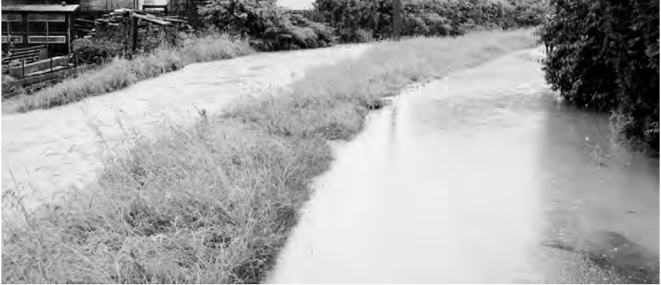
ČERVNOVÉ povodně zasáhly také Komárov.

Pokud bychom hledali nejvýraznější události v Komárově roku 2010, nejspíš by se dalo souhlasit s tím, co je uvedeno v titulku. Na začátku června bolestivě zasáhla velká voda a od podzimu se změnilo vedení městské části. Co se událo dále za uplynulých dvanáct měsíců?