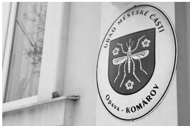
Ilustrační