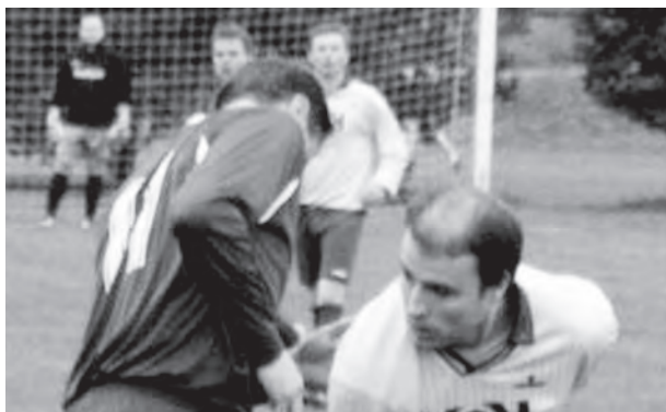
HODNOCENÍ výsledků komárovských mužstev po podzimu není příliš radostné.

Hodnocení podzimu fotbalových soutěží v Komárově vyznívá neradostně. Muži po pádu do III. třídy si vedli se střídavými úspěchy a skončili po polovině soutěže na desátém místě. Vůbec se nedařilo dospotencům a starším žákům, kteří jsou po podzimu poslední. Starší žáci nedokázali v sedmi zápasech získat ani bod. Jediným úspěšným týmem jsou tak minižáci, kteří jsou ve své skupině druzí. (mno)