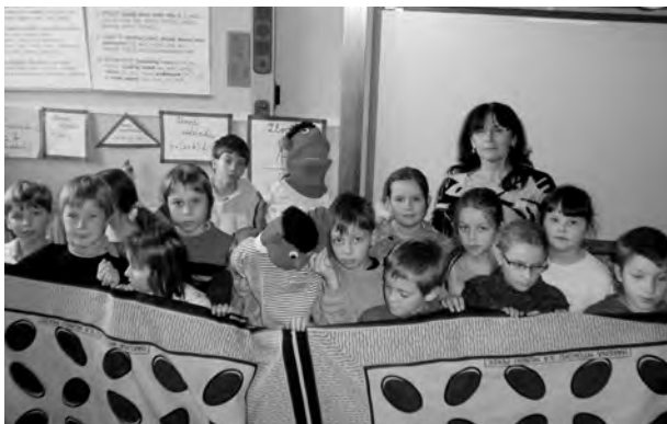
NEJEN JAK SE LIDÉ zdraví v tanzánské vesnici Chekereni měli děti možnost poznat při besedě 10. a 11. listopadu.

Ukázala nám fotky ze života místních dětí a jejich rodičů, ochutnali jsme africké oříšky a plody babobabu. Zazpívali jsme si