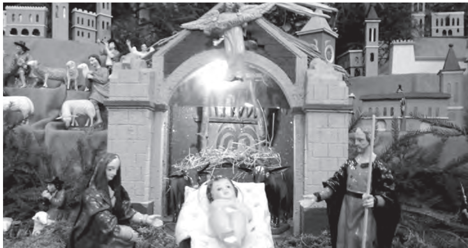
KOMÁROVSKÝ betlém.

Přátelé! Doba adventního očekávání na příchod Mesiáše vrcholí slavením Vánoc. A tak už za pár dnů opět, spolu s celým civilizovaným světem, budeme slavít skutečnost, že se Bůh stal jedním z nás, že se stal člověkem. Proto si také myslím, že je na čase znova si položit odvěkou otázku: Kdo je to vlastně člověk?