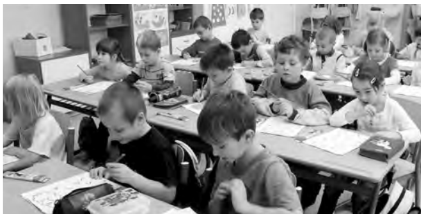
V PRVNÍM KOLE projektu Odemykání 1. třídy si budoucí školáci vedli dobře.