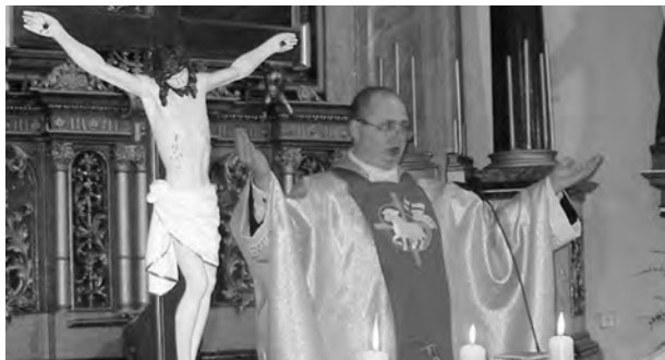
Ilustrační foto archiv

Nepostradatelnou součástí adventního očekávání na Kristův příchod jsou v naší tradici rorátní bohoslužby. Proto i letos srdečně zveme děti, mládež a dospělé na RORÁTY. Prosíme děti, aby si připravili na tyto mše sv. lampióny. Rodiče a prarodiče prosím, ať se všem dětem pomohou zúčastnit těchto adventních bohoslužeb. Dospělí ať si na Roráty přinesou svíčky v kelímku. Roráty se budou konat v Komárově ve středu a v pátek v prvních třech týdnech Adventu a po čtvrté adventní neděli v pondělí a ve středu - vždy v 18.00.