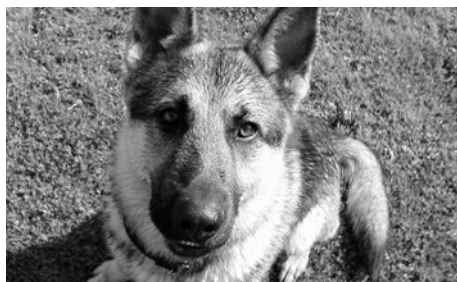
Ilustrační foto archiv

Do 31. března 2015 je nutné uhradit poplatek za psa na letošní rok. Poplatek za psa nebyl navýšen. Majitelé pejsků tak za prvního stejně jako v předešlých letech zaplatí 600 Kč, za každého dalšího pak 900 Kč. Lidé, kteří pobírají jakýkoliv druh důchodu (starobní, invalidní, vdovský, vdovecký či sirotčí), zaplatí pouze 200 Kč za prvního a 300 Kč za každého dalšího psa. Pokud občan žádá o slevu na poplatku z důvodu pobírání důchodu, je nutné, pokud tak již neučinil, aby důchod doložil formou důchodového výměru. (Ime)