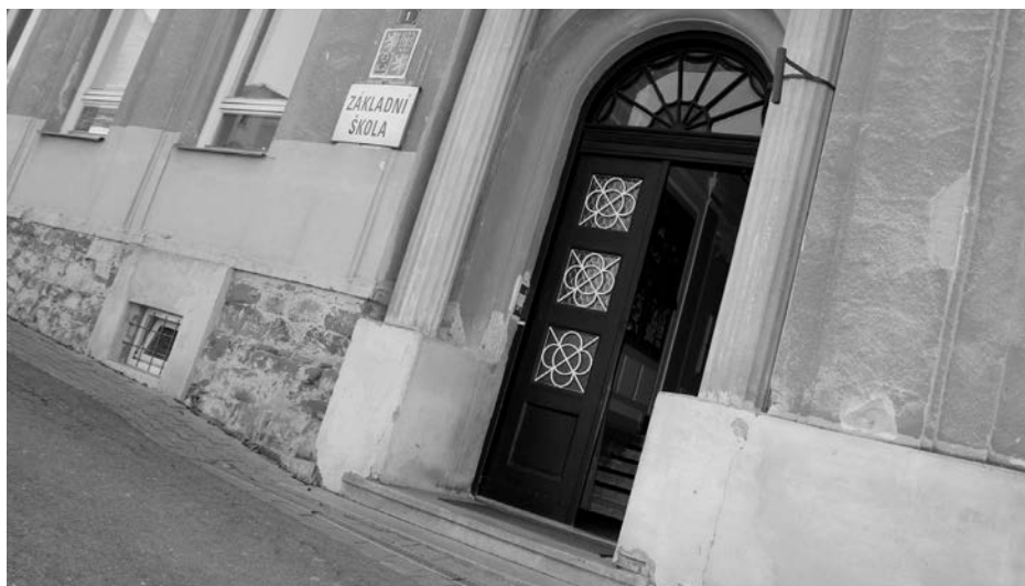
Nová tělocvična vyroste v blízkosti základní školy.