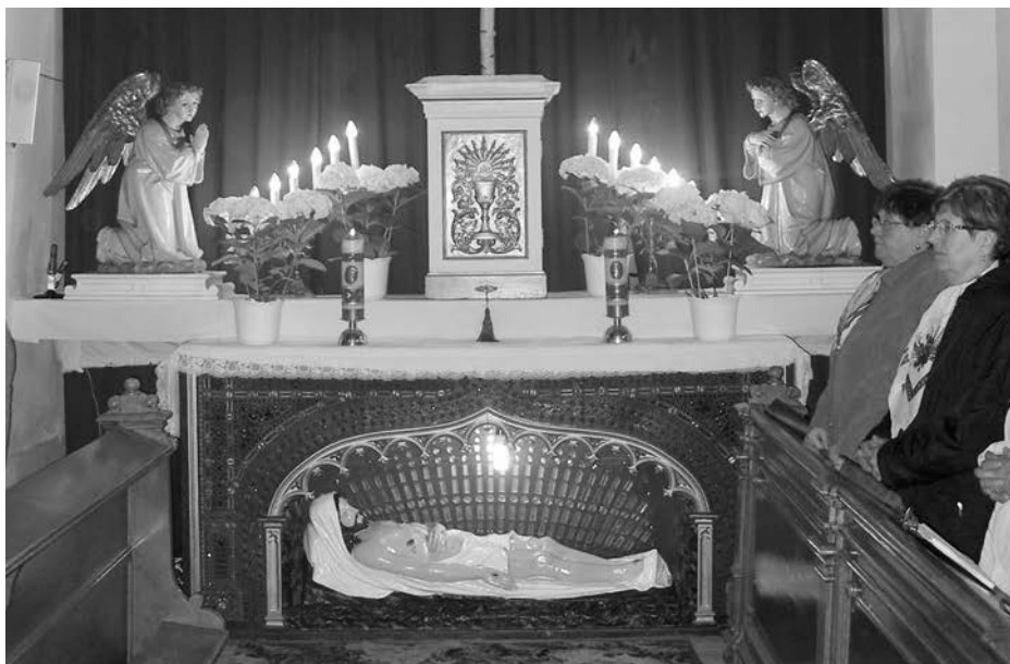
Velikonoce 2015.

který nevěřil svědectvím apoštolů, ale nakonec potkal zmrtvýchvstalého a uvěřil. Celé dějiny křesťanství jsou plné lidí, kteří v různých stoletích, na různých světadílech, v různých kulturách potkávali na svých cestách vzkříšeného Pána Ježíše a hovořili o tom. Potkávali ho ve svých vítězstvích a prohrách, v dobrém i ve zlém, v radostech a strastech, v nemoci a utrpení, v bohatství a chudobě, když se rodili nebo když umírali. Můžeme tedy směle říci, že Ježíš zmrtvýchvstalý byl, je a bude všude tam, kde byl, je a bude aspoň jeden jediný člověk. Protože jeho přáním je, aby každý z nás prožil to, co prožil sv. Tomáš ve večeřadle, to je, aby ho jednou poznal a skutečně uvěřil!