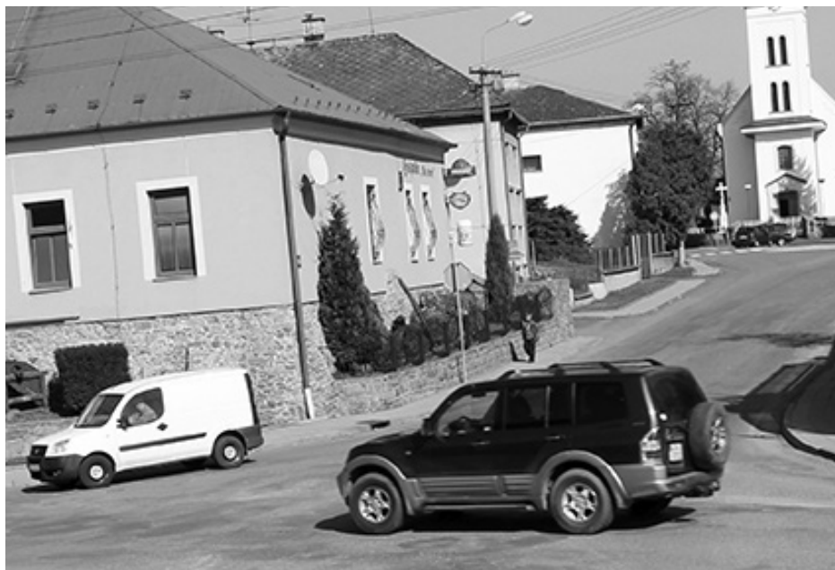
Rekonstrukci čeká i křižovatku ulic Dlouhá a Podvihovská.

od Raduně, narovnění křižovatky, zřízení přechodů pro chodce. Součástí stavby jsou přeložky a úpravy inženýrských sítí. Rekonstrukce by měla přispět ke zvýšení bezpečnosti především chodců a zvýšení přehlednosti ve výhledu pro motoristy. Doba realizace je cca 70 dnů. Termín zahájení zatím není znám, předpokládá se v období květen až říjen 2015. Po dobu stavby bude uzavřena silnice ve směru na Raduň. Doprava ve směru na Podvihov bude probíhat kyvadlově (řízenou světelnou signalizací) v jednom jízdním pruhu. O konkrétním datu realizace a uzávěrkách komunikací Vás budeme operativně informovat.