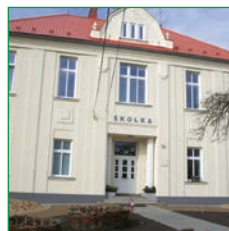
MŠ NOVÉ SEDLICE

Pracujeme podle vlastního ŠVP PV SE ZVÍŘÁTKY DO POHÁDKY s ekologickým zaměřením.