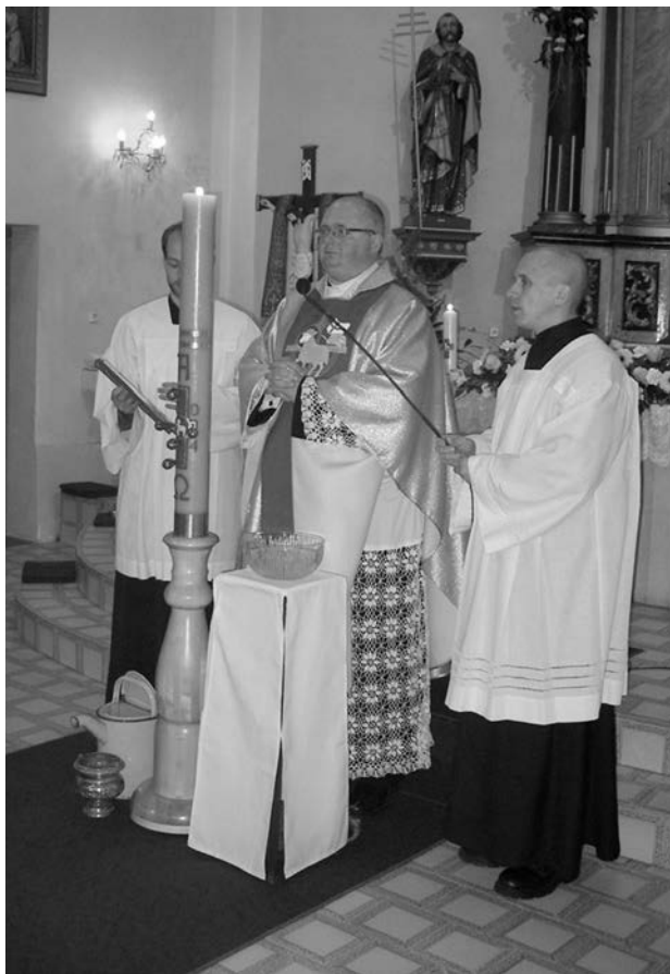
Velikonoce 2015.