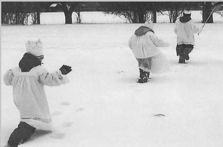
Ilustrační foto Charita Opava