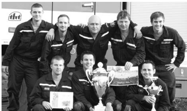
Hasiči budou letos v květnu obhajovat pohár primátora.

Soutěž Jednotek sboru dobrovolných hasičů Statutárního města Opavy „O putovní pohár primátora města“ proběhne dne 23. května 2015 od 13.00 hodin na hřišti v bývalých Dukelských kasárnách v Opavě. Pořadatelem je letos Sbor dobrovolných hasičů Opava Kateřinky. Přijďte podpořit komárovské hasiče, kteří obhajují své loňské vítězství. V ročníku 2014 skončilo naše družstvo na druhém a v roce 2013 na třetím místě.