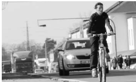
Letos započne I. etapa výstavby cyklostezky.

ry, které škole dlouhodobě chybí, jako šatna, kabinet, WC či úklidová komora. Stavba je zahrnuta do Integrovaného plánu rozvoje města jako dodatečný projekt. Financována tedy bude jak z dotací, tak i z rozpočtu města. Veškeré práce by měly být v souladu s dotačním titulem ukončeny v prosinci letošního roku. Věříme, že se tato dlouhodobě