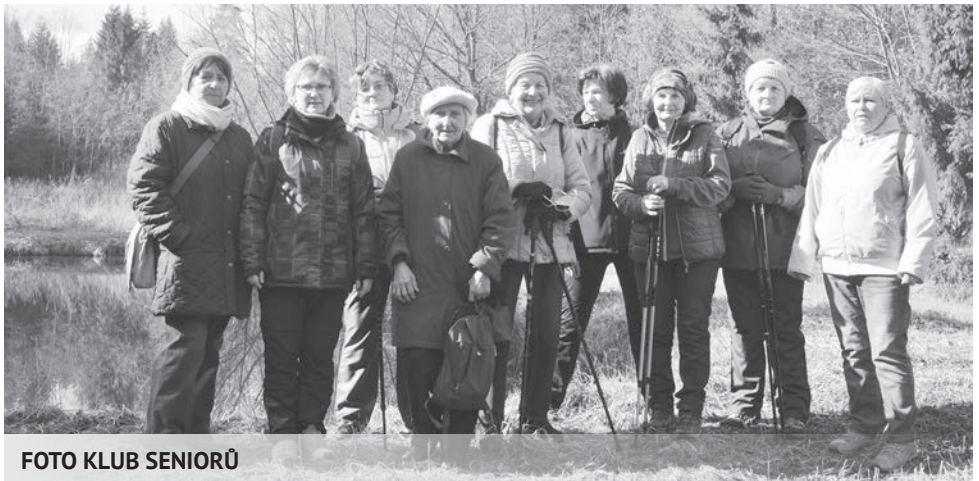
FOTO KLUB SENIORŮ