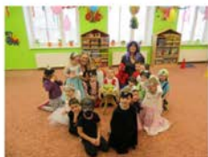
MŠ Nové Sedlice