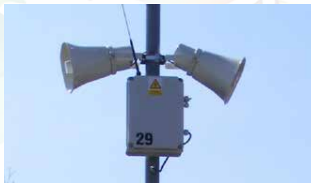
bezdrátový rozhlas ilustrační