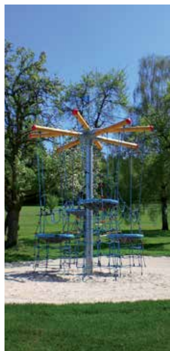
nápady pro Opavu-strom s hnízdy