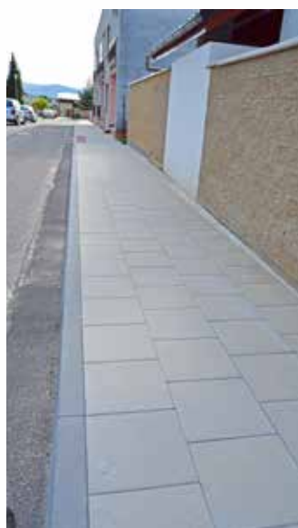
chodník U Tržnice