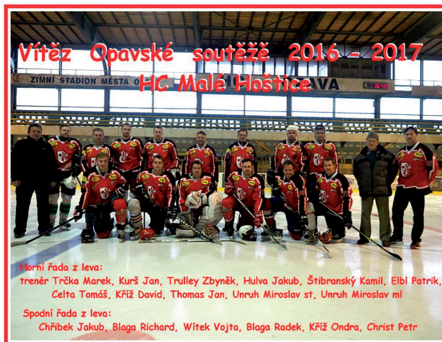
Foto Vítězného týmu pro sezonu 2016-2017