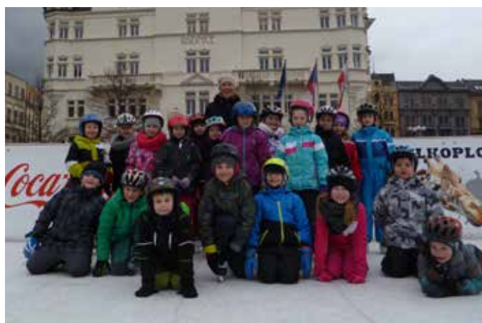
děti školní družiny na umělé ledové ploše u Hlásky