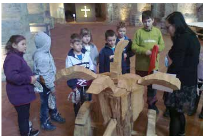
žáci 3. třídy na výstavě Magičtí Lucemburkové

břicha, tu nad únavou. Pokud je dítě na učení samo, asi neodvede tak precizní výkon, jako žák, který se pravidelně učí pod dohledem dospělých. Proto by tady dospělí měli být tolerantnější ke školním výkonům a vyvarovat se zákazů, nepřiměřených požadavků, nebo děti za známky dokonce trestat. „Špatná“ známka není signálem k potrestání dítěte, ale výzva ke společnému řešení problému. Zlatá střední cesta, přiměřený a trvalý zájem o dítě, je krůčkem na cestě úspěšného žáka.