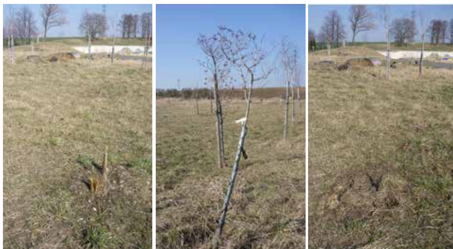
Byl krásný... Kůly někdo odstranil, asi A ještě jeden...ach jo... na topení...