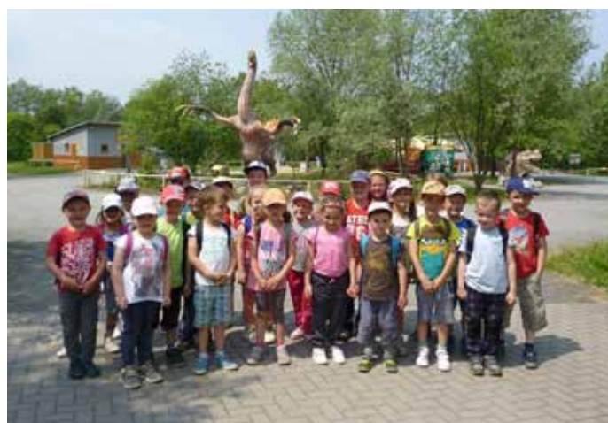
Za Klub rodičů při MŠ Jana Pivodová