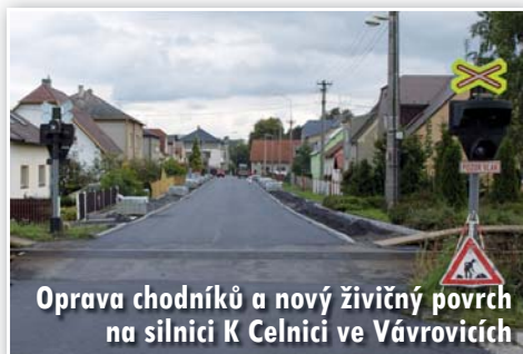
Oprava chodníků a nový živý povrch na silnici K Celnici ve Vávrovicích

Opravu financovala Správa a údržba silnic MSK (3,3 mil. Kč) a Statutární město Opava (1,8 mil. Kč).