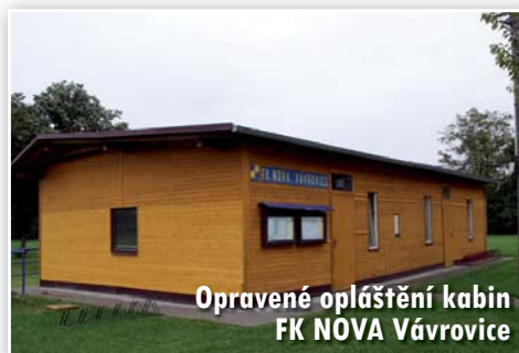
Opravené opláštění kabin FK NOVA Vávrovice

Demontován a sešrotován byl nefunkční rozhlas, v přípravě je projektová dokumentace na nový bezdrátový rozhlas pro celou městskou část.