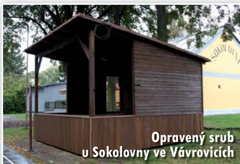
Opravený srub u Sokolovny ve Vávrovicích