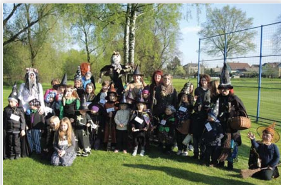
Stavění májky a slety čarodějnic na Palhanci a ve Vávrovicích