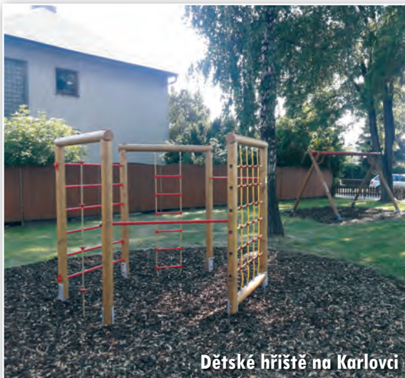
Dětské hřiště na Karlovci

ve Vávrovicích či úpravám stávajících hřišť. V případě, že bude některý z prvků na hřišti poničen, v zájmu bezpečnosti dětí nás prosím informujte.