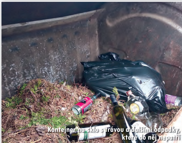
Kontejner na sklo s trávou a dalšími odpady, které do něj nepatří

Stávající kvóta na popelnice (zelené i hnědé) je 1 ks na čtyři osoby na jedné adrese, pro pět a více osob jsou to pak popelnice 2. Na základě podnětu a konzultaci s Technickými službami, které svoz zajišťují, je možné ve výjimečných případech přidělit druhou popelnici i tam, kde žijí 4 osoby či méně. Popelnice bude přidělena na základě osobního jednání na Úřadu městské části, zejména se jedná o rodiny s ma-