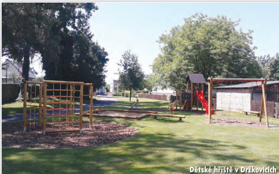
Dětské hřiště v Držkovicích