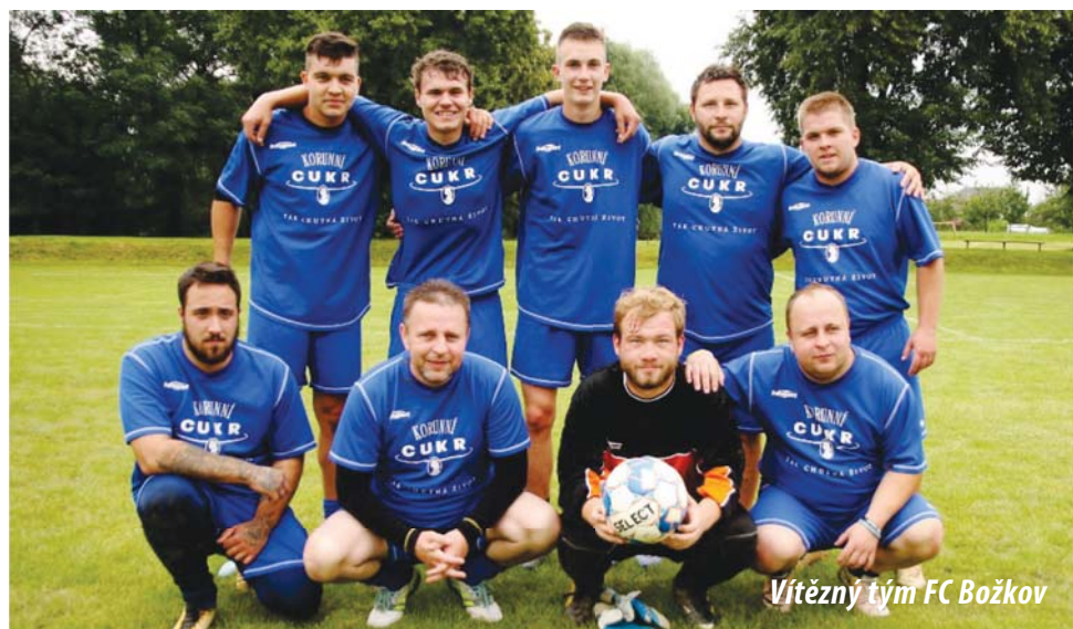
Vítězný tým FC Božkov