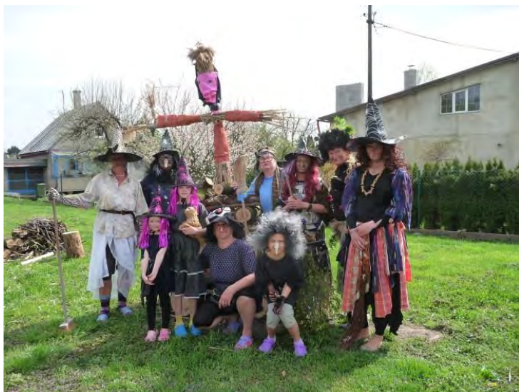
Na postavenou Májku se přiletěly podívat čarodějnice

1 v květnu se konalo dost akcí, které ovšem ovlivnilo nevlídné počasí. Nejprve se jednotky dobrovolných hasičů naší MČ, ale i celého okresu, účastnily soutěže O pohár primátora, tzv. „Primátorek“ (letos v Podvihově) a pokračovala i fotbalová soutěž. V poslední květnový den se u Sokolovny musel kvůli nevhodnému terénu (po vytrvalých deštích) bez náhrady zrušit plánovaný Dětský den, avšak palhaneckými hasiči avízované kácení Máje se uskutečnit podařilo.