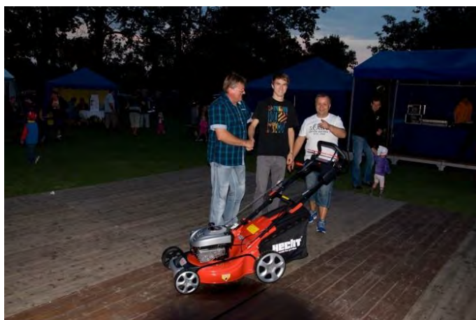
Předávání hlavní ceny

Na konci září Zemědělské družstvo Hraníčář otevřelo své brány návštěvníkům na Dni otevřených dveří.