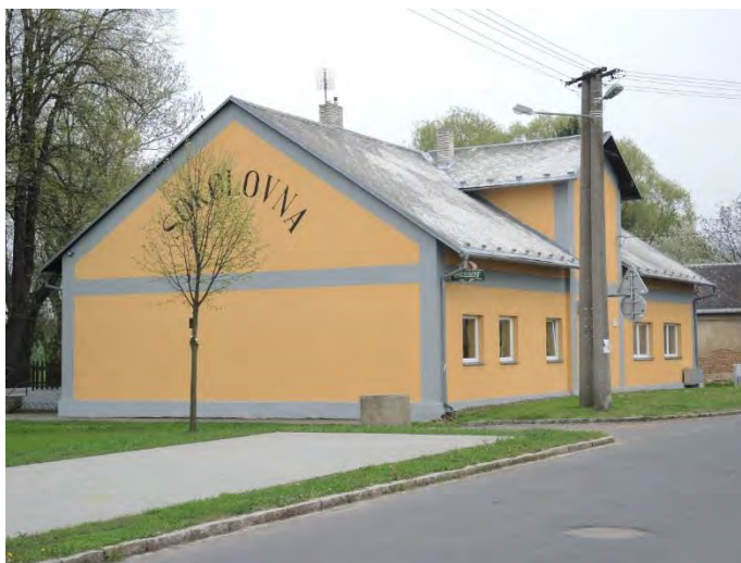
Sokolovna v novém