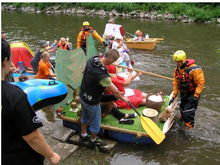
Trokyáda – plavba od vávrovické Sokolovny po řece Opavě až k mlýnskému stavidlu na Palhanci