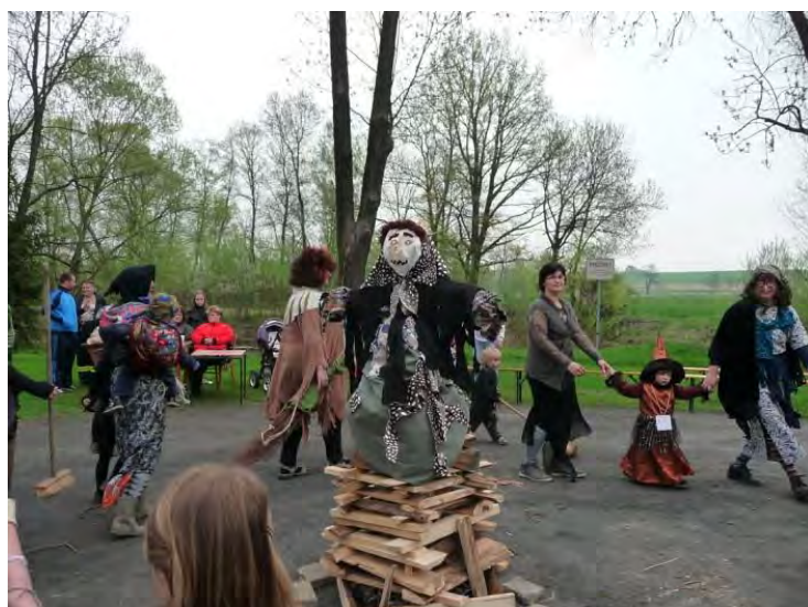
U Sokolovny ve Vávrovicích se za účasti všech létajících ježibab a čarodějnic pálila tato „kráska“