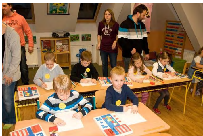
... a jak jsou na školu připraveni