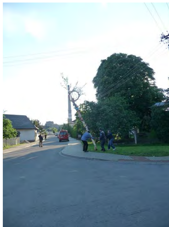
Celý měsíc se Májka poctivě hlídala (pečlivě uschována), tak bylo na konci května co kácet