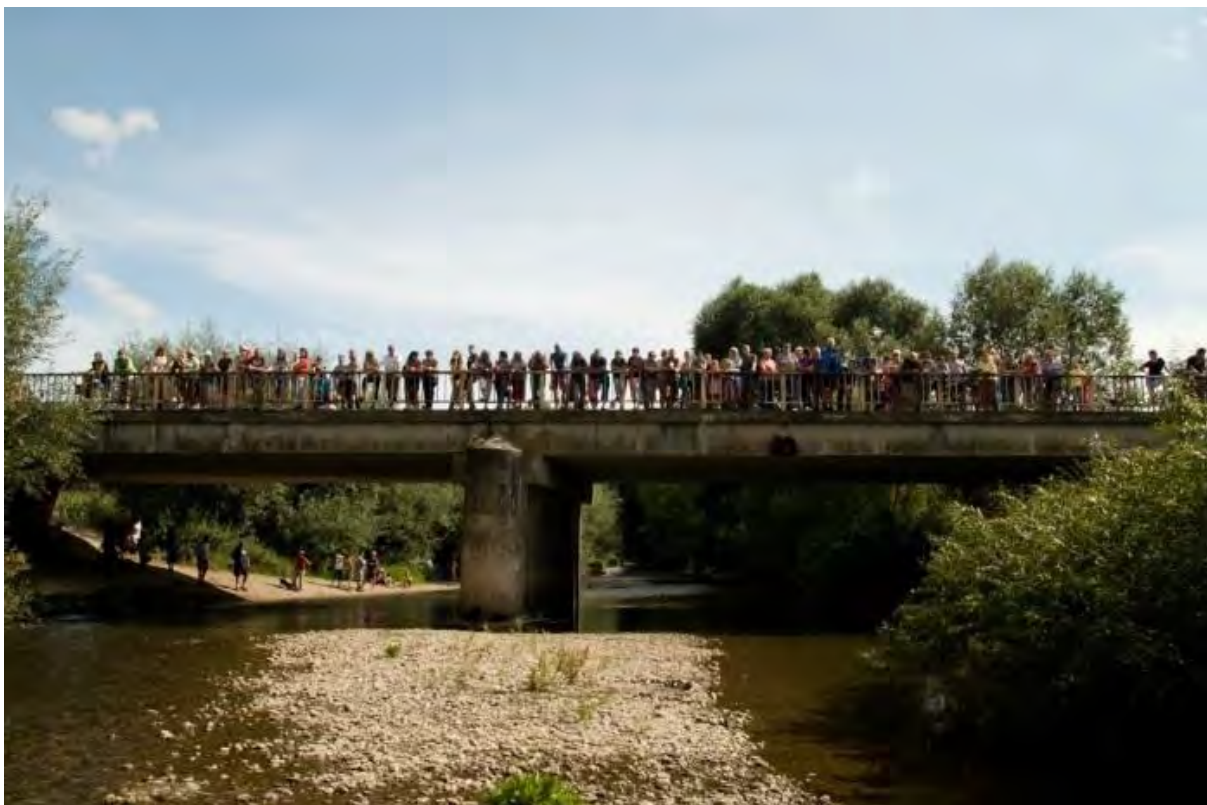
Téměř vyschlé koryto řeky Opavy, most přes řeku Opavu ve Vávrovicích na hranicích mezi Českem a Polskem u bývalé celnice – Neckyáda SDH Vávrovice, srpen 2013

Babí léto trvalo docela dlouho a teplého počasí obecně jsme si užívali i po celý říjen, kdy ještě i v druhé polovině měsíce bylo kolem 20 °C a na mnoha meteostanicích se opět přepisovaly historické rekordy.