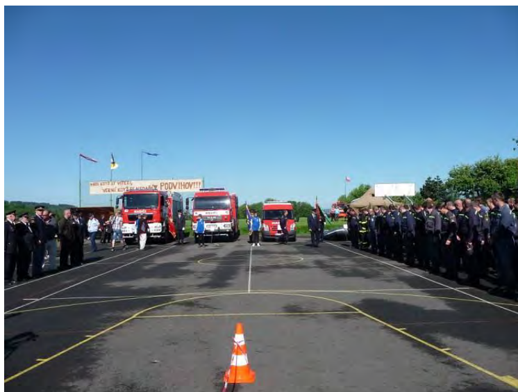
Slavnostní nástup všech jednotek před zahájením soutěže