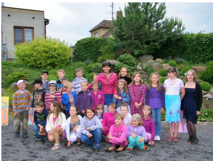
S úsměvem na rtech se děti loučily se školou