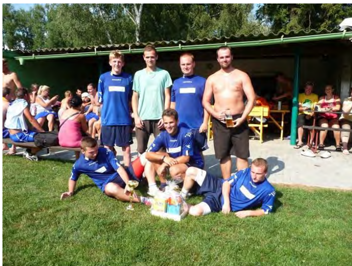
Vítězové NOVA Cupu

Prázdniny začaly Ligou veteránů, hasičskou soutěží na Palhanci, a poté jsme si mohli užít taneční zábavu TJ Sokol u Sokolovny. Hned začátkem srpna proběhl ve Vávrovicích fotbalový turnaj NOVA Cup, následovaný Trokyádou, kterou organizoval SDH Palhanec.