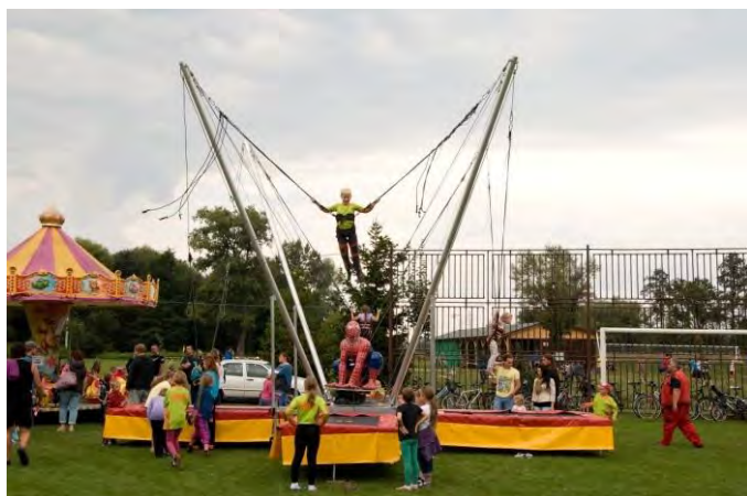
Obří Euro Jump