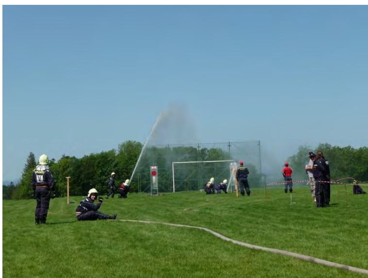
A jedna z našich jednotek v akci