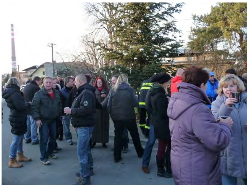
A na Palhanci