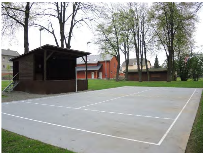
opravený srub a taneční parket/hřiště