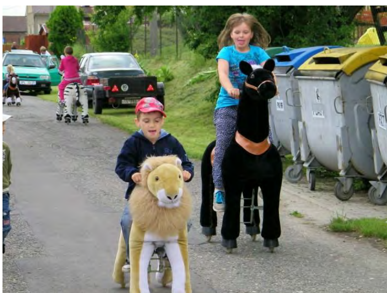
Hlavně menším dětem udělalo radost překvapení klubu rodičů v podobě jezdících zvířátek