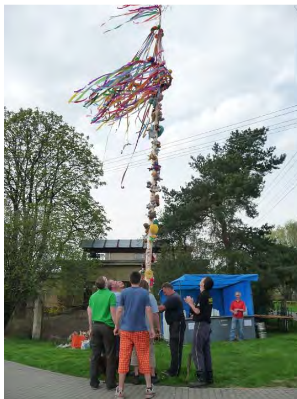
Palhanečtí hasiči u stavění Máje naproti hasičské zbrojnice