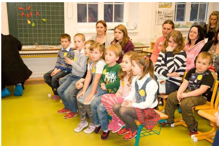
Budoucí prvňáčci u zápisu...

Naši malí občánci šli v lednu k zápisu do školy, všichni nedočkaví a možná i trochu bojácní, copak je bude čekat. Ale určitě se těšili, jak se předvedou, co už všechno umí a jak jsou připraveni k nástupu do školy.