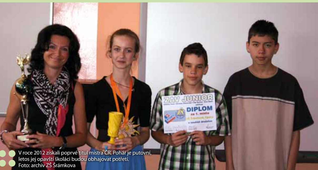
V roce 2012 získali poprvé titul mistra ČR. Pohár je putovní, letos jej opavští školáci budou obhajovat potřetí.

Žákům Základní školy Šrámkova v Opavě se daří sklízet úspěchy na všech soutěžích v psaní na počítačové klávesnici.