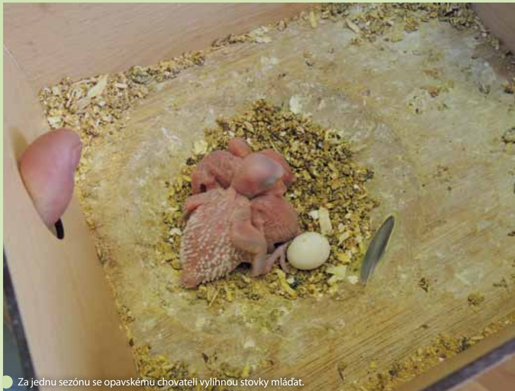
Za jednu sezónu se opavskému chovateli vylíhnou stovky mláďat.

Ročně se opavský chovatel účastní dvacítky výstav po celé Evropě. A protože soutěžit mohou andulky ne starší než z předchozího roku, nutí to chovatele pořád vychovávat nové. „Musím mít dopředu sestavený plán, kdy který pták půjde na kterou výstavu. To už