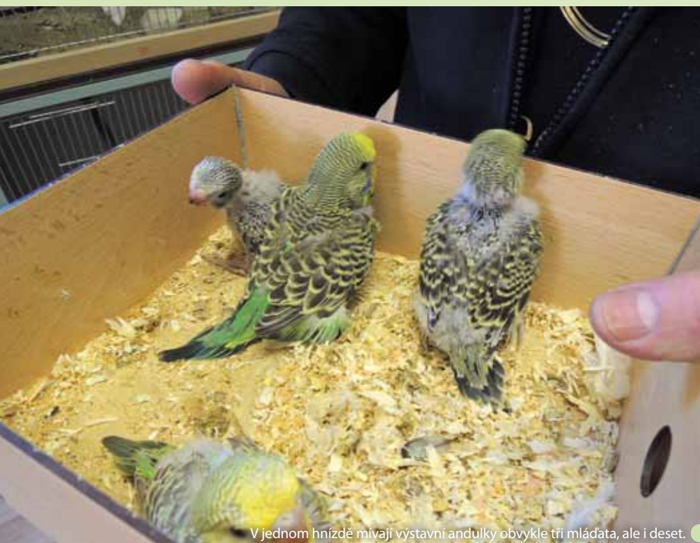
V jednom hnízdě mívají výstavní andulky obvykle tři mláďata, ale i deset.

Aby opeřenec získal specifické znaky a požadované vlastnosti, musí chovatel sestavit vhodný pár. Představa, že samec šampion s výstavní samicí zákonitě zplodí špičkového potomka, je naivní. Výstavní andulka musí splňovat přísná kritéria. Podle standar-