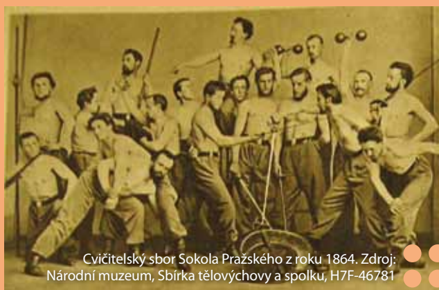
Cvičitel'ský sbor Sokola Pražského z roku 1864.