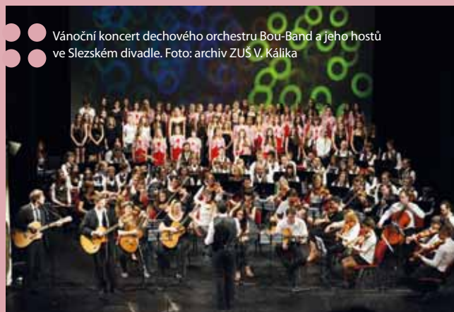
Vánoční koncert dechového orchestru Bou-Band a jeho hostů ve Slezském divadle.

Škola v posledních letech založila několik festivalů. Prvním byl Magický klavír v proměnách času, který se letos koná už potřetí, o rok později vznikla hudební přehlídka Smyčcové dialogy. Letos škola zakládá také kytarový festival. Aktivitu podpořilo Sdružení rodičů a přátel uměleckých škol a také město Opava.