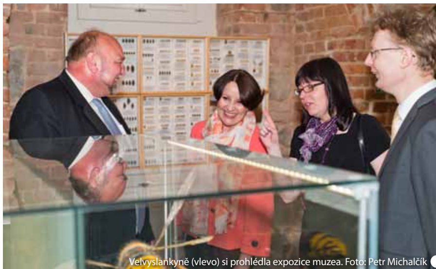
Velvyslankyně (vlevo) si prohlédla expozice muzea.

Velvyslankyně si po oficiálním uvítání prohlédla město z radniční věže a poté se vydala na prohlídku dopravního podniku. Po obědě a vycházce městem pak navštívila Historickou výstavní budovu Slezského zemského muzea. Odpolední program ukončila na půdě Slezské univerzity, kde přednášela a besedovala se studenty o zahraniční politice své země.