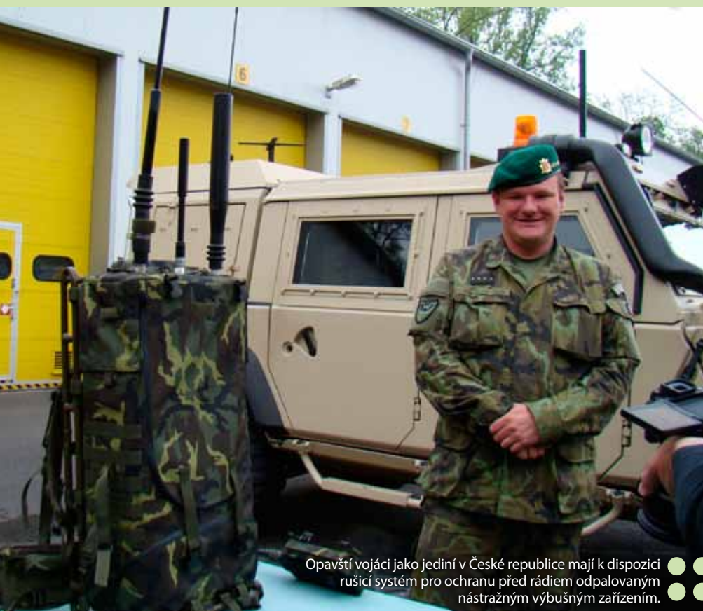
Opavští vojáci jako jediní v České republice mají k dispozici rušící systém pro ochranu před rádiově odpalovanými nástrahami výbušným zařízením.

Kromě nové techniky letošní rok opavským vojákům přináší intenzivnější výcvik a přípravu na zahraniční operace. „Na domácí půdě to bude například certifikační cvičení se 4. brigádním úkolovým uskupením či plukovní cvičení Ghost Hunters v součinnosti s Národní gardou Spojených států, státu Nebraska. V zahraničí to budou cvičení Unified Vision v Norsku, Steadfast Indicator v Rumunsku a Khann Quest v Mongolsku. Dále jsme připraveni se svojí jednotkou k vyslání pro síly rychlé reakce NATO (NRF) 2014 a budeme se připravovat k dosažení certifikace další jednotky určené pro NATO (NRF) 2015. Jedním z nejdůležitějších úkolů bude příprava specialistů průzkumu a elektronického boje pro zahra-