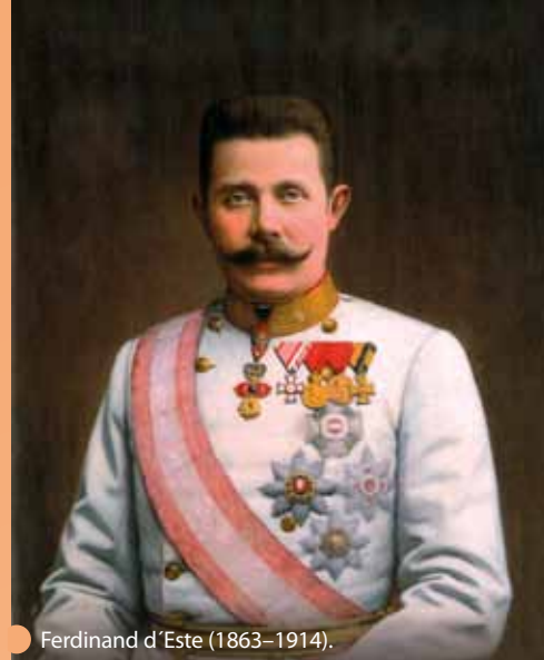
Ferdinand d'Este (1863–1914).

Tento měsíc uplyne již 100 let od chvíle, kdy se rakouský následník trůnu František Ferdinand a jeho choť Žofie stali 28. června 1914 oběťmi atentátu. Vražda v Sarajevu byla jedním z faktorů, které způsobily 1. světovou válku, jedním z mnoha.