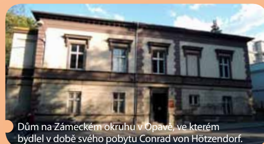
Dům na Zámeckém okruhu v Opavě, ve kterém bydlel v době svého pobytu Conrad von Hötzendorf.

Životní příběh tohoto muže se z velké části skládá z hořkých zklamání, ústrků a osudových ran. Nenaplněné naděje a těžká nemoc jsou dva rozhodující aspekty, které poskytují klíč k pochopení jeho rozporuplné osobnosti. Tato psychopatologická situace vysvětluje mnohá arcivévodova rozhodnutí i jeho vy-