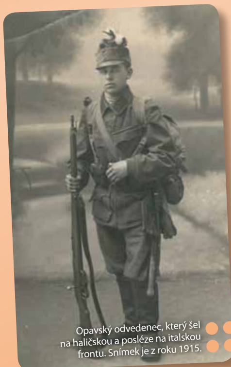
Opavský odvedenec, který šel na haličskou a posléze na italskou frontu. Snímek je z roku 1915.

Ferdinand d'Este s nefalšovaným nadšením, že dosud nikdy nenarazil na tak inteligentní mužstvo a bezvadný pořádek. Malý, cholerický plukovník rozšafně odpověděl následníkovi trůnu: Víím, Císařská Výsostí, mí vojáci jsou nejlepší v celém Rakousku.“ Tak popsal historický životní okamžik Hötzendorfovy kariéry německý spisovatel Ludwig Winder (1889–1945) v knize Následník trůnu.