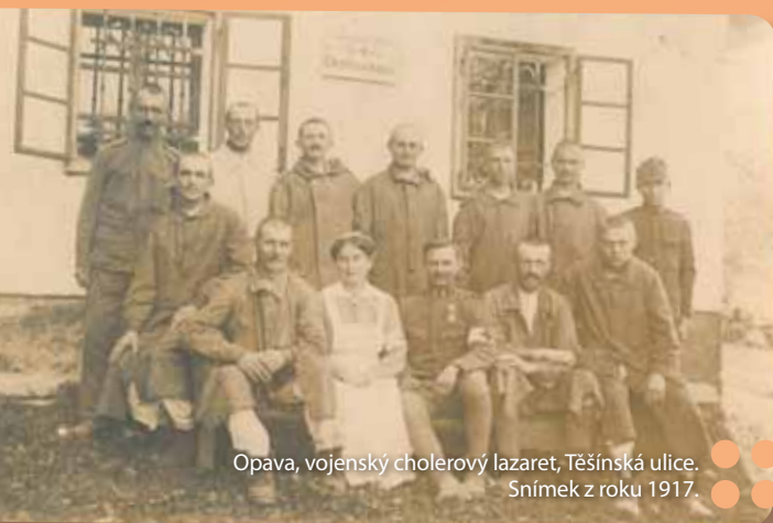
Opava, vojenský cholerový lazaret, Těšínská ulice. Snímek z roku 1917.

Hlavní město Bosny Sarajevo. Neděle, 28. června 1914. Nádherné slunečné počasí. Automobilová kolona následníka trůnu Františka Ferdinanda d'Este se díky fatálnímu omylu – změně trasy – na pár sekund