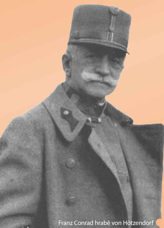
Franz Conrad hrabě von Hötzendorf

Vztah mezi ním a císařem Františkem Josefem I. byl velmi napjatý. Od chvíle, kdy si František Ferdinand na císaři vymohl souhlas k sňatku s hraběnkou Žofíí Chotkovou, kterou nadevše miloval, jež mu však nebyla svým stavem rovná, takže jejich svazek znamenal hrubé porušení pravidel habsburského domu, stala se propast mezi oběma muži nepřeklenutelná. Následnický pár byl ze strany vídeňského dvora terčem neustálého ponižování všemi možnými způsoby; na jejich vzorné manželské soužití to však nemělo sebemenší vliv. Nástupce trůnu svou choť hluboce miloval a ctil a z jejich manželství vzešly tři děti.