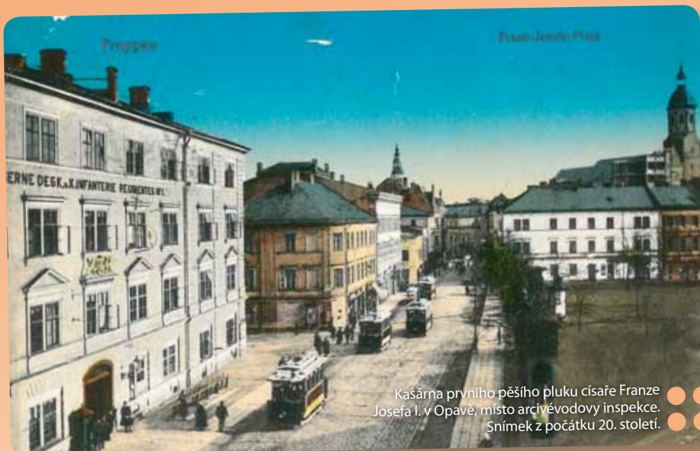
Kasárna prvního pěšího pluku císaře Franze Josefa I. v Opavě, místo arcivévodovy inspekce. Snímek z počátku 20. století.

„Zatímco všichni důstojníci a velitelé očekávali inspektora od 6 hodin v hotelu Koruna, konal arcivévoda inspekci v kasárnách, kde mu imponovala čistota a duch mužstva. Po přijetí hlášení Hötzendorfa sdělil mu F.