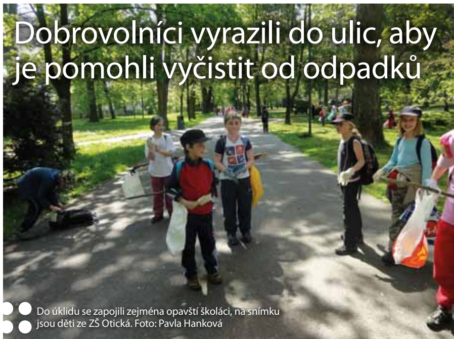
Do úklidu se zapojili zejména opavští školáci, na snímku jsou děti ze ZŠ Otická.

Více než sto pytlů odpadu nashromáždili zástupci neziskových organizací, veřejnost a zejména školáci, kteří se dobrovolně zapojili do jarního úklidu města.