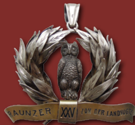
Figurka sovy vystavená v expozici Cesta města představuje božstvo uctívané v měšťanských salonech 19. století.