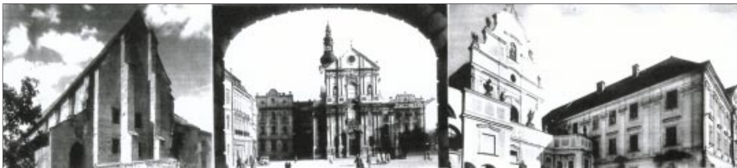
• Bývalý Dominikánský klášter s kostelem sv. Václava.