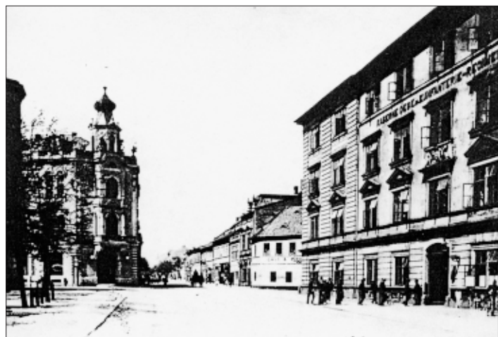
Kasárna 1. pěšího pluku (vedle OD Breda, zbourána v roce 1939)