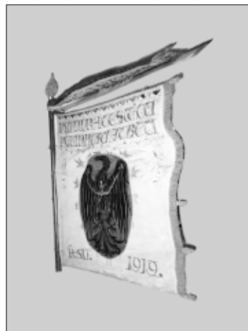
Prapor opavského pěšího pluku 15

Během druhé světové války byla v Opavě velká týlová posádka německé armády, kterou tvořil mj. 28. granátnický pluk a vojenská nemocnice. Odpor českého obyvatelstva proti okupantům se projevil činností odbojových organizací Obrana Slezska, Obrana kraje Opavského aj. Počátkem roku 1945 Němci provizorně upravili za okupace devastovaná opevnění k obraně, doplnili je polním opevněním, minovými poli a překážkami. 20. března byla Opava vyhlášena za pevnost a její předpolí tvrdě hájeno při Ostravské operaci Rudé armády, které se zúčastnili také čs. tankisté a letci. Po těžkých bojích Opavu osvobodili ve dnech 22.–23. dubna 1945 vojáci 60. armády generálplukovníka P. A. Kuročkina. Němečtí vojáci kladli odpor ještě několik dnů poté v některých pevnostech. Hlavní útok se v dalších dnech soustředil na Ostravu, která byla osvobozena 30. dubna 1945. Do opavských kasáren se postupně vrátili českoslovenští vojáci, mj. i část obnoveného pěšího pluku 15, jehož velitelství bylo ale v Hranicích na Moravě. Slavnou minulost opavské posádky československé armády připomíná dnes prapor pěšího pluku 15 v pražském Armádním muzeu, na němž je vyšito heslo: První na cestě cti, povinnosti a oběti.