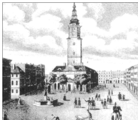
Horní náměstí (kresba J. Linslera)