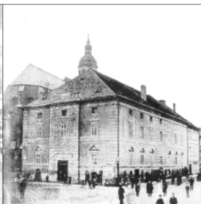
Městské divadlo (dobová fotografie)