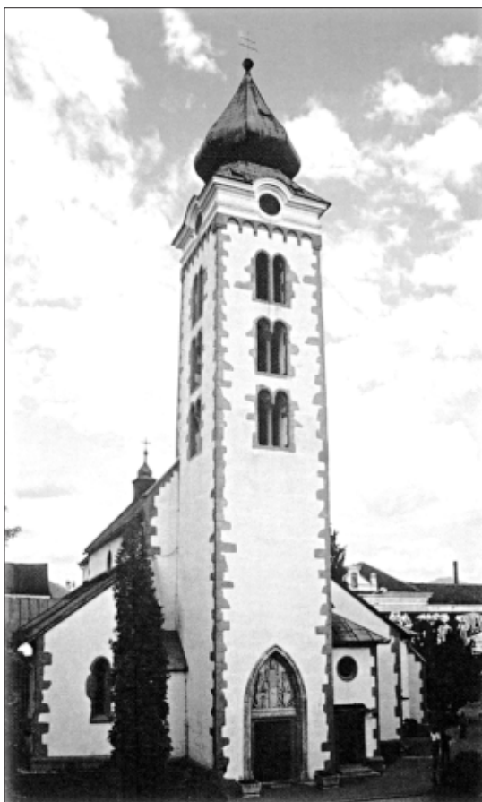
Kostel sv. Mikuláše na Náměstí osvoboditelů

Liptovský Mikuláš stal administrativním, hospodářským, kulturním a turistickým centrem Liptovska a od roku 1960 i velkého okresu v kraji banskobystrickém vzniklého sloučením s okresy Ružomberok a Liptovský Hrádok. Se vznikem nových okresů v roce 1996 se opět odloučil okres Ružomberok. K 31. 12.