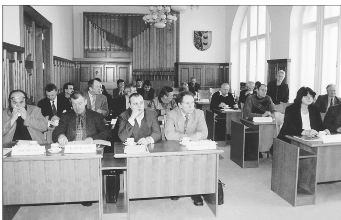
Pohled na účastníky valné hromady.