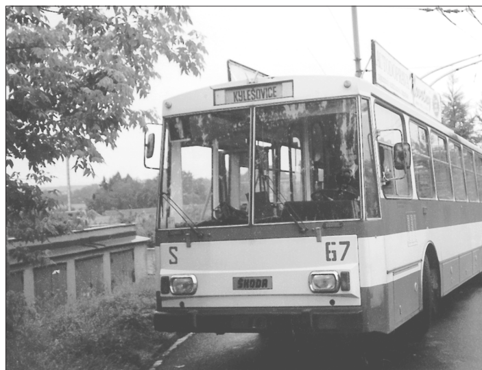
Brzy budeme jezdit za jiných podmínek.