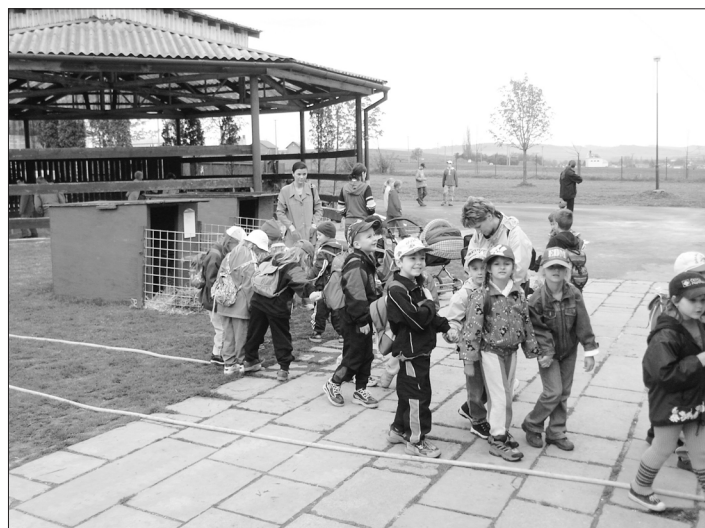
Den Země je pro děti přitažlivý.

V průběhu měsíce dubna proběhne řada akcí zaměřených na aktivní oslavy Dne Země. I nadále svoji pozornost zaměřujeme na čisté životní prostředí. Tentokrát jsme si vzali na mušku nebezpečné odpady.