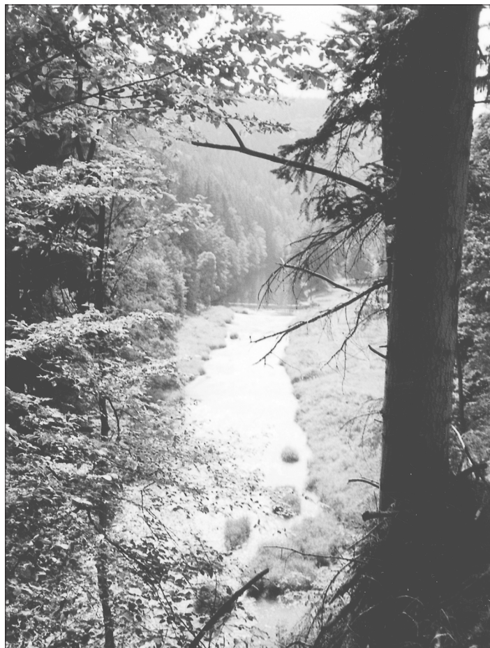
Ochrana přírody je jen částí náplně odboru životního prostředí.