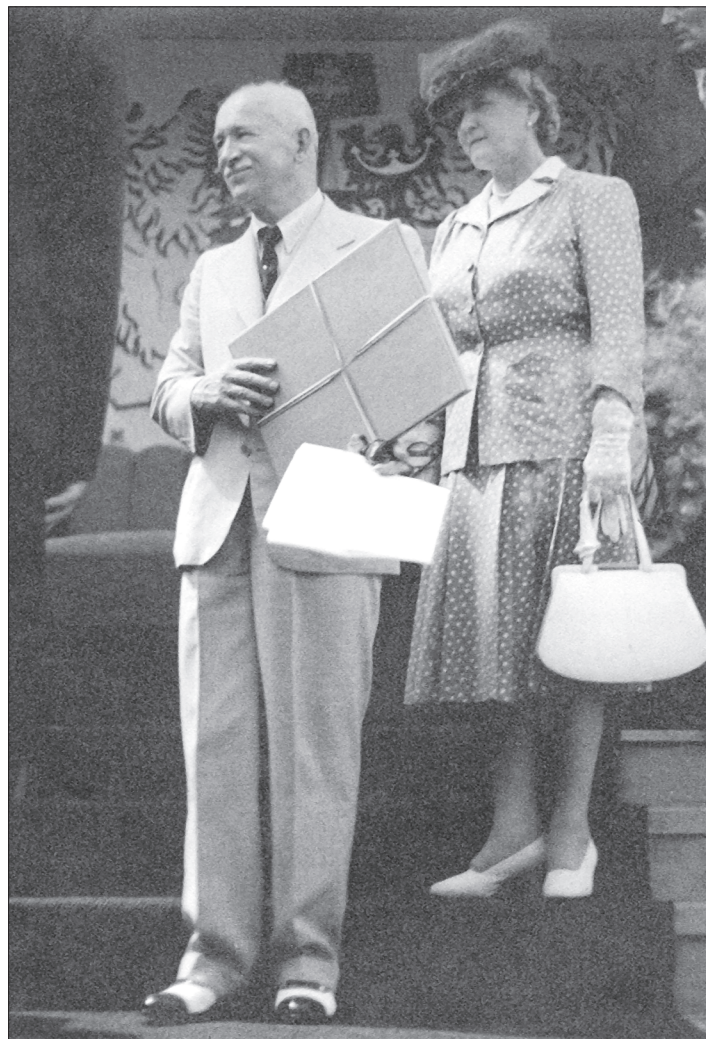
Edvard Beneš s chotí.