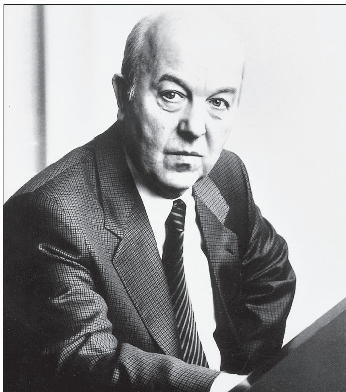
Fenomenální klavírista Ivan Moravec vystoupí na zahajovacím koncertu 42. ročníku interpretační soutěže Beethovenův Hradec.