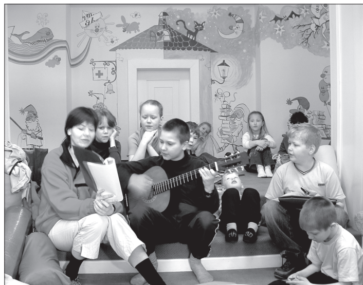
Noc strávená v knihovně byla pro děti nevědním zážitkem.