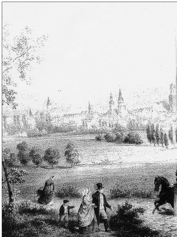
Opava v polovině 19. století. (Podle kresby F. Kalivody, Slezské zemské muzeum).