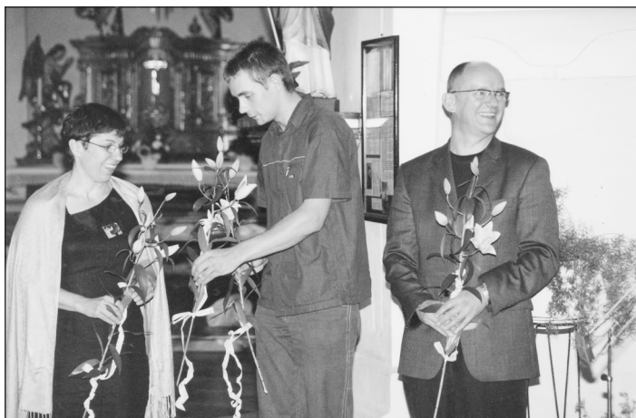
Skladatel a dirigent Bob Chilcott na festivalu Bezručova Opava.