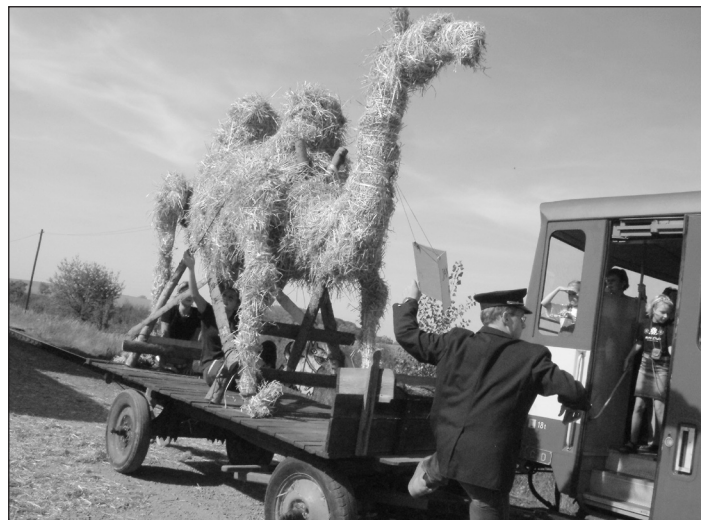
Projekt Divadlo na trati.