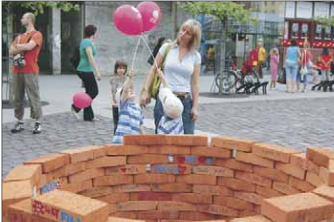
Loňská Akce Cihla přilákala spoustu diváků i dárců. Krásné počasí nám přálo.

Akci Cihla snad ani není zapotřebí občanům Opavy představovat. Na předchozí tři ročníky této benefiční akce, během níž můžete zakoupením jedné cihly pomoci mentálně postiženým osobám, letos naváže již čtvrtý ročník. A také letos na Vás čeká setkání se známými osobnostmi, které přijdou tuto akci podpořit. Celebritou letošní Akce Cihla a její patronkou v Opavě je Miss České republiky 1995 a Miss Europe 1995 Monika Žídková. Na opavském Horním náměstí můžete od středy 3. do čtvrtku 4. června od 9 do 17 hodin opět navštívit stánek Charity Opava a potkat mentálně postižené klienty, kteří se na akci podílí. Postavte věž z cihel, napište pěkné vzkazy a setkejte se známými osobnostmi. Výtěžek letošní akce je určen na dovybavení chráněného bydlení v Domě sv. Cyrila a