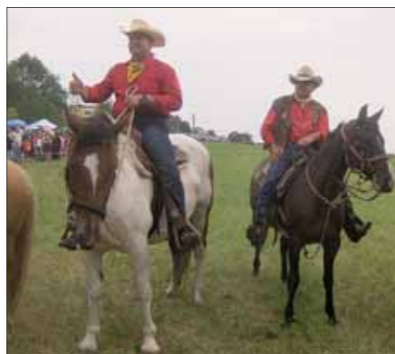
a Slovensko a končí na maďarských hranicích.

Opava se stala pravidelnou letní zastávkou koňské pošty, kterou si skupiny nadšenců připomínají jednu z velkých legend z dob pistolníka Bufalo Billa. Evropský Pony Express je stále populárnější a expanduje. Letošní jízda startuje v Holandsku, přes Německo, Českou republiku