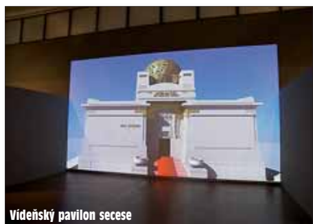
Vídeňský pavilón secese

O d poloviny června až do posledních zářijových dnů hostí hlavní město Rakouska největší výstavu, která kdy byla uspořádána na počest opavského rodáka, architekta Josepha Maria Olbricha.