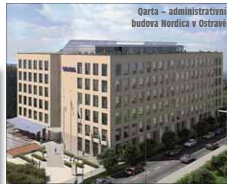
Qarta - administrativní budova Nordica v Ostravě

Vítězství v kategorii průmyslových staveb patří Studio-D. Získalo jej za pro-