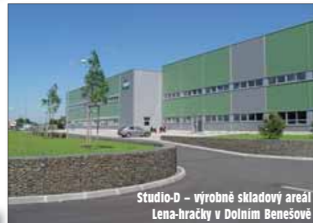
Studio-D - výrobně skladový areál Lena-hračky v Dolním Benešově

Ateliér 38 získal hlavní cenu soutěže Grand Prix a první cenu v kategorii staveb občanské vybavenosti za polyfunkční dům v Ostravě-Vítkovicích. „Dům získal titul Dům roku statutárního města Ostravy a je možné jej najít také