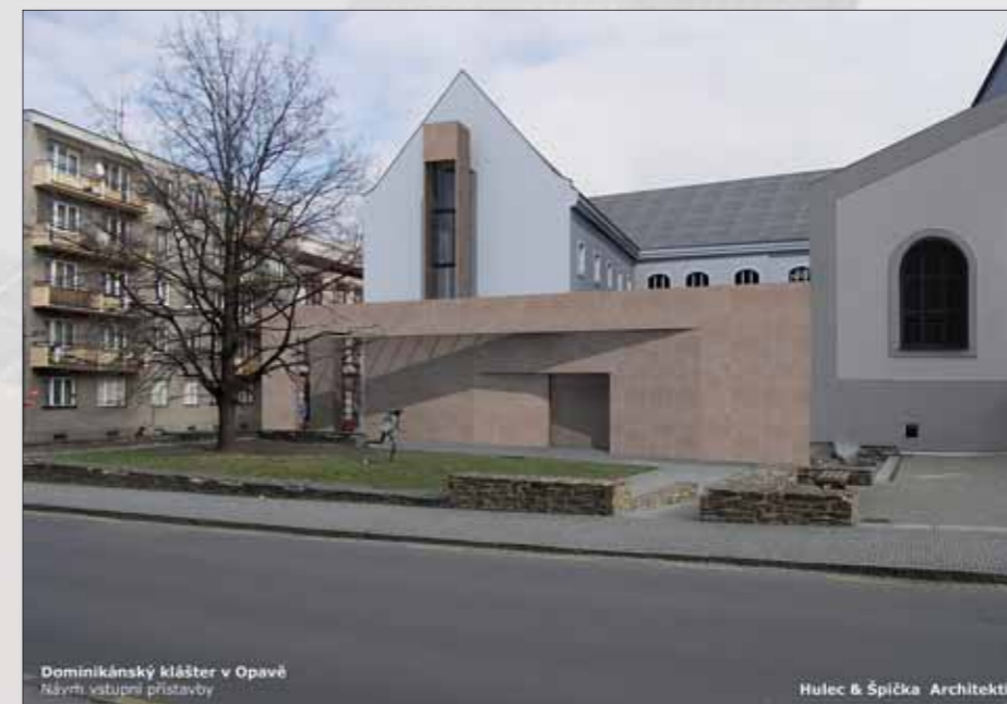
Dominikánský klášter v Opavě Návrh vstupní přístavby