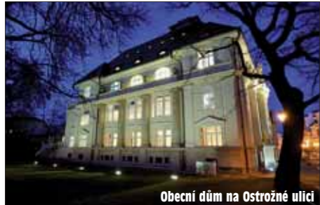
Obecní dům na Ostrožné ulici

O pava dominovala letošnímu předávání architektonických cen na soutěži Stavba Moravskoslezského kraje. Opavské stavby, opavské ateliéry či opavští architekti získali ceny téměř ve všech kategoriích. Čestné uznání v nejvíce obsazené kategorii získal Obecní dům na Ostrožné ulici. Porota ocenila způsob rekonstrukce, jaký město a Opavská kulturní organizace zvolily.