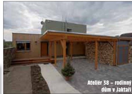
Ateliér 38 - rodinný dům v Jaktai