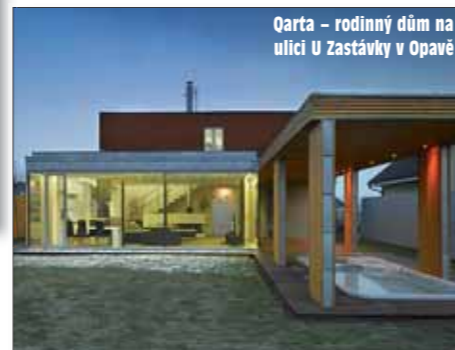
Qarta - rodinný dům na ulici U Zastávky v Opavě

Ateliér Qarta si získal pozornost dvěma stavbami. Tři roky práce a konečná podoba administrativní budovy Nordica v Ostravě byly oceněny Cenou odborné poroty za ekologii. Podobně jako v loňském roce získal ateliér čestné uznání v kategorii rodinných domů, tentokrát za rodinný dům na ulici U Zastávky v Opavě.