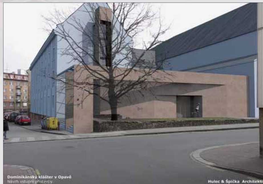
Dominikánský klášter v Opavě Návrh vstupní přístavby

Přízemí bývalého kláštera čeká rozsáhlá architektonická úprava. Velkou proměnou projde vstupní fasáda na Pekařské