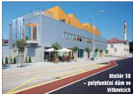
Ateliér 38 - polyfunkční dům ve Vítkovicích