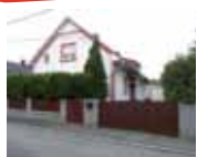
RD 5+1 3.990.000 Kč