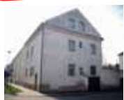
Bytový dům 3.280.000 Kč