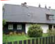
Chalupa 4+1 2.100.000 Kč