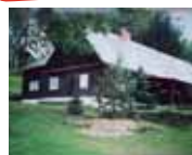
Chalupa 3+1 1.990.000 Kč