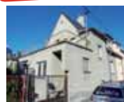
RD 5+1 4.150.000 Kč