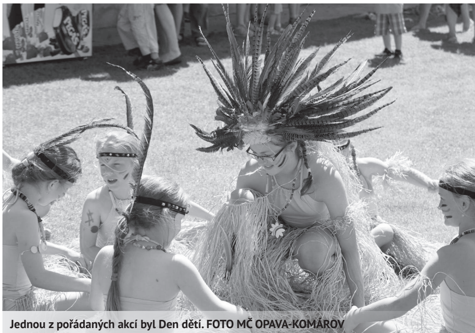
Jednou z pořádaných akcí byl Den dětí.

- Vánoční koncert žáků MŠ a ZŠ Komárov a vánoční jarmark (proběhne 21. prosince v kostele sv. Prokopa od 16.00 hodin), všichni jste srdečně zváni