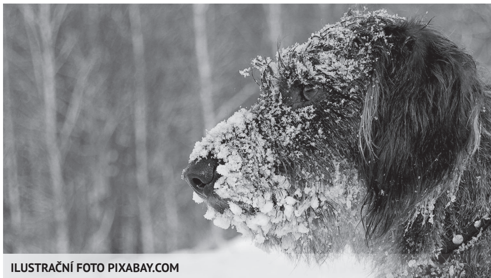
ILUSTRACNÍ FOTO PIXABAY.COM

I VÍTĚZSLAV ŠINDLÁŘ, MYSLIVECKÁ STRÁŽ MS HOŠTATA