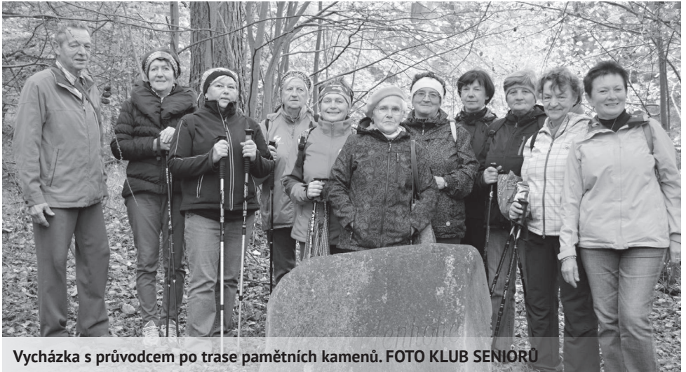
Vycházka s průvodcem po trase pamětních kamenů. FOTO KLUB SENIORŮ

Na počátek prosince jsme si už tradičně připravili mikulášské posezení s drobným občerstvením, dárky i bilancováním už šestého roku od založení našeho klubu. S radostí můžeme