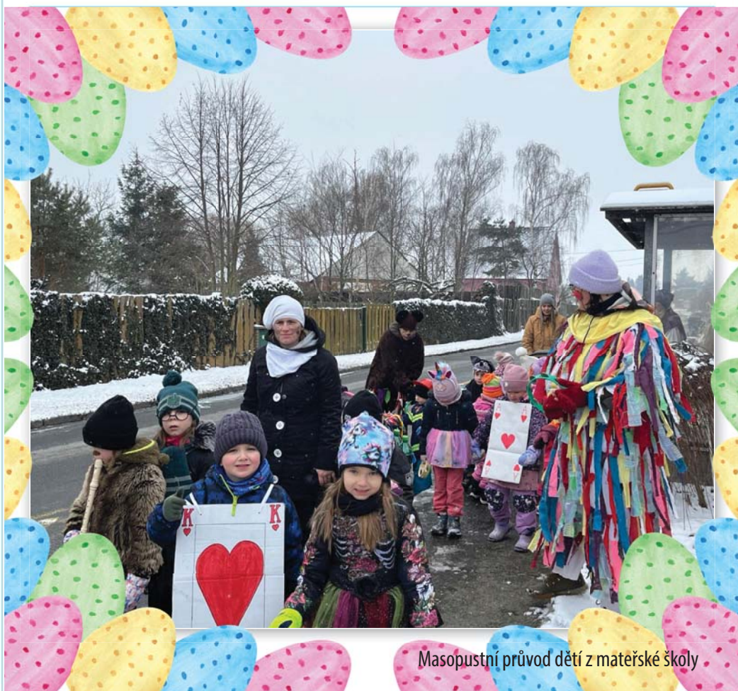
Masopustní průvod dětí z mateřské školy